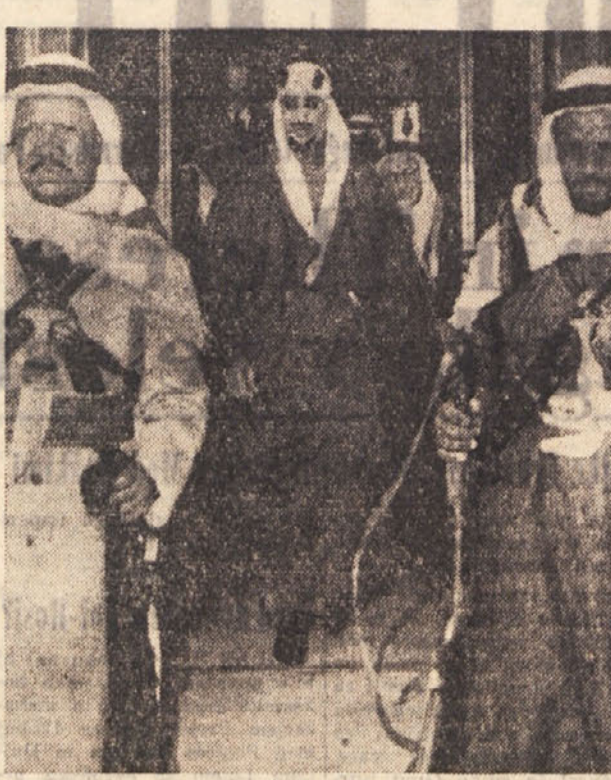
Da, Ibn Saud je Tržačan po svoji materi Mariji Zorzi, hčerki tržaškega trgovca, ki se je preselila v Arabijo in bil tam častni konzul bivše avstrovske monarhije vse do prve svetovne vojne. Ko je Arabija stopila na stran antant, konzula internirala, hčerka pa je izgubila. Sele pozneje se je zvedelo, da je postala četrta žena očeta sedanjega arabskega monarha in umrla leta 1919 za posledicami kuge, ki je takrat razsajala po Evropi in Aziji.