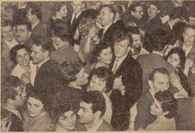
Minuto po polnoči v soboškem »Partizanu«

Lendavski Partizan je pripravil ljudem prijetno silvestrovanje.