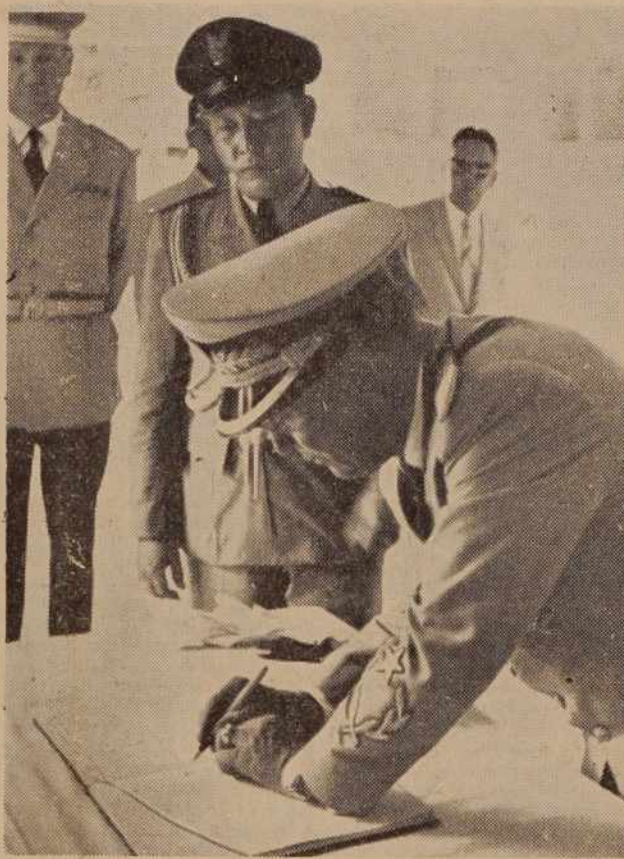
Predsednik Tito med svojim obiskom v Indoneziji

80.000,00 metrov sukanca. Tovarna zaposluje trenutno 587 delavcev in uslužbencev. Kolektiv tovarne »Mura« ima tudi letos velike načrte: skladišče za surovine in 20 stanovanj za delavce.