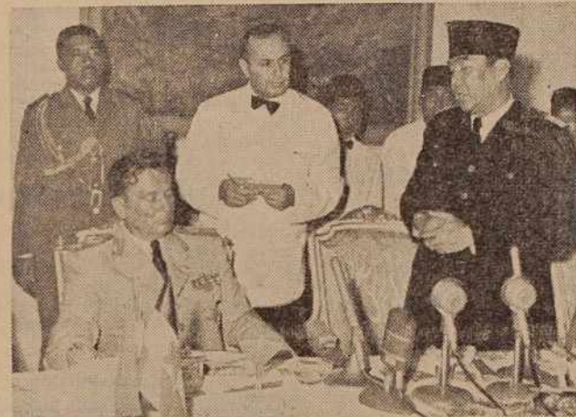
Z obiska v Indoneziji: med zdravico predsednika Sukarna