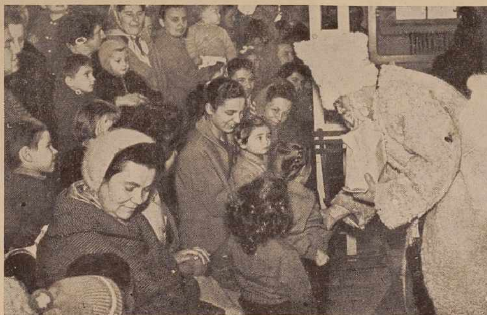
Ob novem letu nas je obiskal dedek Mraz in obdaril naše najmlajše, kar pričča tudi pričujoč posnetek iz Tovarne perila v Murški Soboti. — O tem, kako so delovni ljudje pričakovali Novo leto 1959, berite na 6. strani!