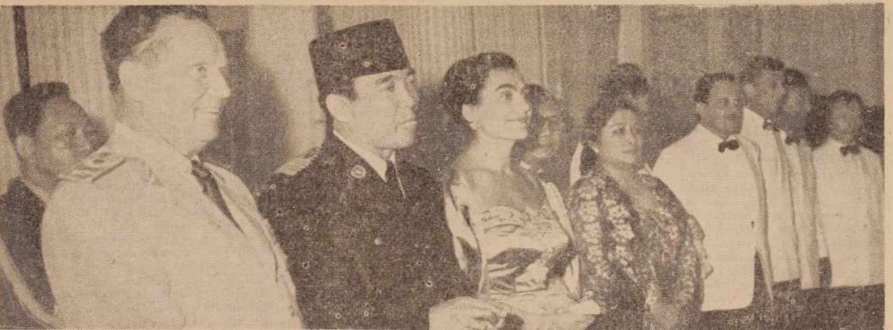
S svečanega sprejema v palači »Istana Negara«, uradni rezidenci predsednika Tita med bivanjem v Indoneziji

Po razpravi je omenjeni seji sveta za vstvo OLO so se zedinili za isče glede honorarnega delzjavili so se za to, da naj zdravnik v 6 urah redne silitve ves čas 100 odst. zapr in če ne gre drugače, v ptovalnici, vendar naj bo zu, ki ga zdravnik dobi, odplačila njegovo