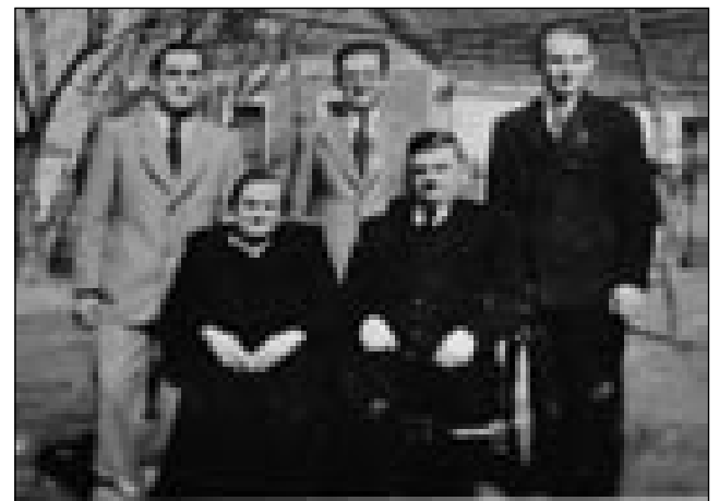
Na starom kejpi s starišami pa dvóma bratoma. Djauži so prvi s prave strani

se moramo držati, pa naj niške ne proba vujti, zato ka ga včasín tastrlijo. Prajli so, ka maro za nami pripelajo, dapa nikdar več nejsmo je vidli. Samo telko smo meli, ka smo v rokej nes-