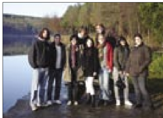
Pri jezeru Hársas

hajali smo se pri jezeru Hársas, smo kegljali in se tudi kopali v monoštrskih Termah. Zvečer pa so vsi lahko okusili, kakšna je prava madžarska palinka. V nedeljo smo šli na