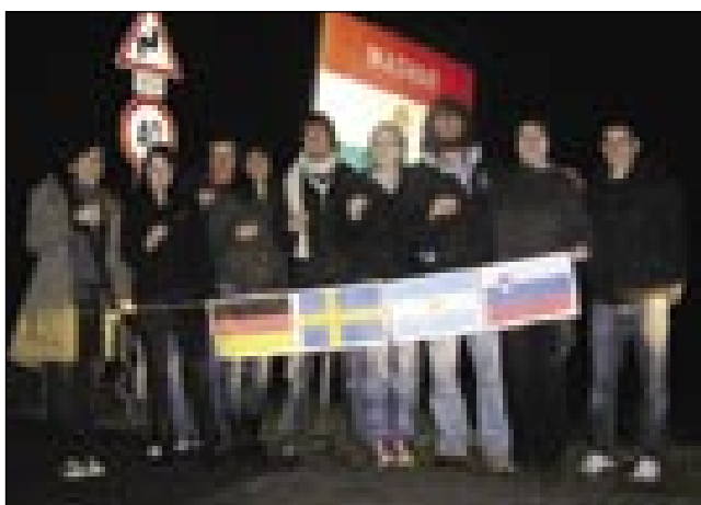
Na nekdanjem prehodu Verica-Čepinci

izlet v Őrség. Naši prijatelji so se zelo dobro počutili pri