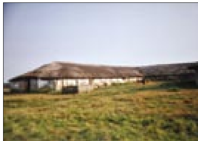
V takši barakaj so živali na Hortobágyi

»Krave, konji, vsevküp osemnajset glav živine. Te so potistim na Rönök pelali v zadrugo (szövetkezet), šištja (svinje) pa na Se-