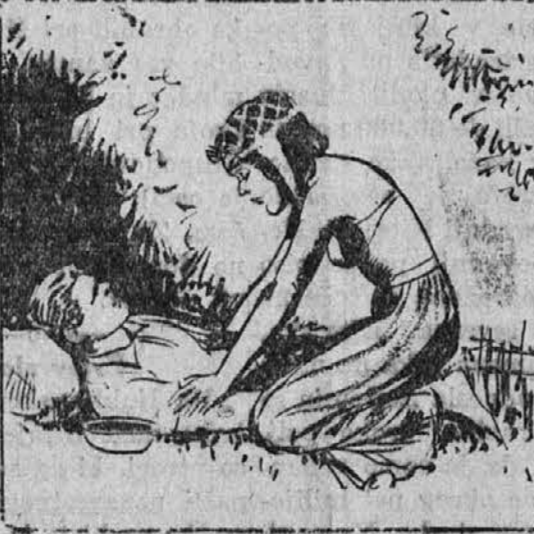
Po dnevu je La nabirala in pripravljala razna zdravilna zelišča za svojega bolnika Colta, ponóci je pa vsa zaskrbljena sedela poleg njega in vneto molila k starodavnim bogovom.