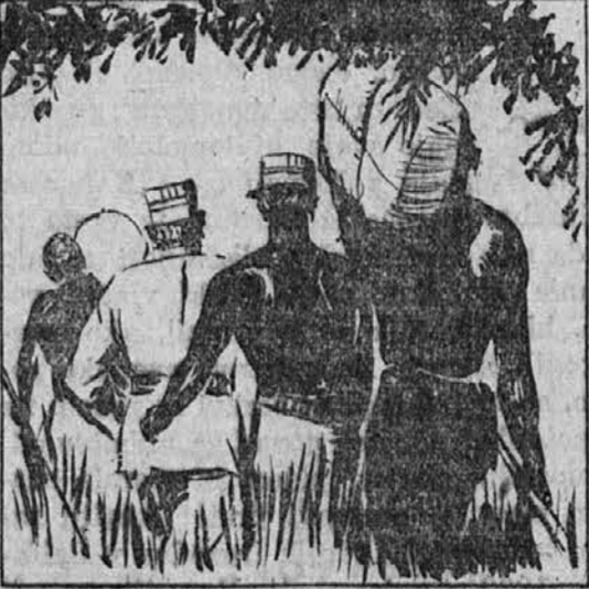
Počasi so minevali dnevi in medtem, ko je Colt ležal brez moči radi silne mrzlice ki ga je tresla, je Zveri s svojo bando korakal proti italijanski Somaliji; Tarzan si je pa pozdružil svoje rane ter zopet nastopil pot zasledovanja Zverovete ekspedicije in mala N kima je veselo čebjala na njegovi rami.