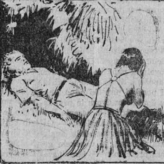
Medtem ko je La klečala pri Coltovih nogah in molila, ali pela čudne neznane in starodavne obredne pesmi v še manj znanem mu jeziku ter pri tem izvajala vsakovrstne geste, ki so spadali k obrednim vajam, jo je Colt ves začuden gledal.