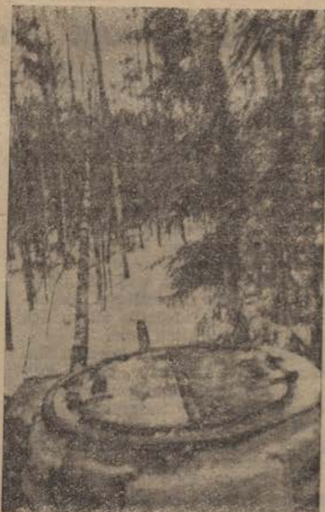
Deutsche Panzerkampfwagen brechen durch den Wald auf eine gut befestigte feindliche Stellung. Blick über den Geschützturm auf die vom Panzer umknickenden Bäume

Während die Raupen der schweren Zugmaschine mühsam durch den gefrorenen Schnee knirschen, um das Geschütz heranzubringen, haben die Pioniere in fieberhafter Eile ihre schwere Arbeit aufgenommen. Sprenglöcher werden in den harten Boden gebohrt, die Ladungen angebracht, die die steinhartgefrorene Erde zerreißen. »Hinlegen!« Eine Leuchtkugel schießt hoch, taucht für Sekunden alles in Licht. Langsam sinkt sie nie-