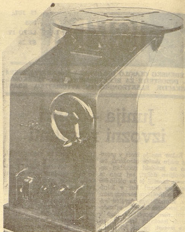
Pozicioner za avtomatsko varjenje LED 2 C, ki jih izdeluje »Iskra« za firmo LINDE iz Münchna

Da bi se stvar izvedla v predpisanem roku, je med drugim bil sprejet sklep DS tovarne, da v kolikor delovne enote ne bi izvršile sklepa DS tovarne o prenehanju dela v predpisanem roku ali pa ne bi odpustile predvidenega števila delavcev, se znižajo osebni dohodki za %, ki se izračuna iz razmerja med številom delavcev, katerim niso odpovedali in med skupnim številom zaposlenih v delovni enoti. To znižanje osebni dohodkov naj bi veljalo do dokončne izvršitve sklepov DS tovarne.