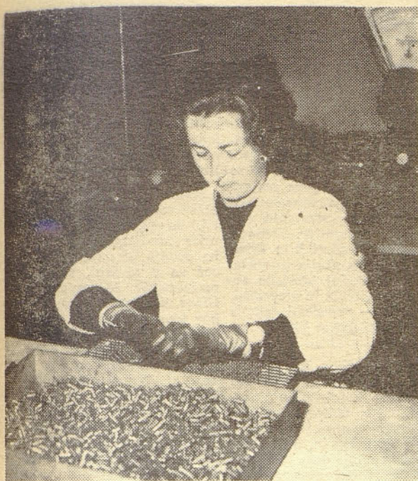
Albinca Kirar nalaga v Sentjernej 2 W upore na metalizacijske letve