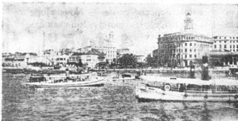
Pogled v pristanišče Port Said ob Sueškem prekopu. Ime je dobilo mesto po Said paš, ki je bil velikodušni pokrovitelj Francoza Ferdinanda Lessepsa, graditelja tega svetovnega prekopa

■ Okenskih šip zdaj v Londonu silno primanjkuje, zima pa vedno bolj pritiska. Večina šip je namreč popokala o priliki eksplozij nemških letalskih bomb.