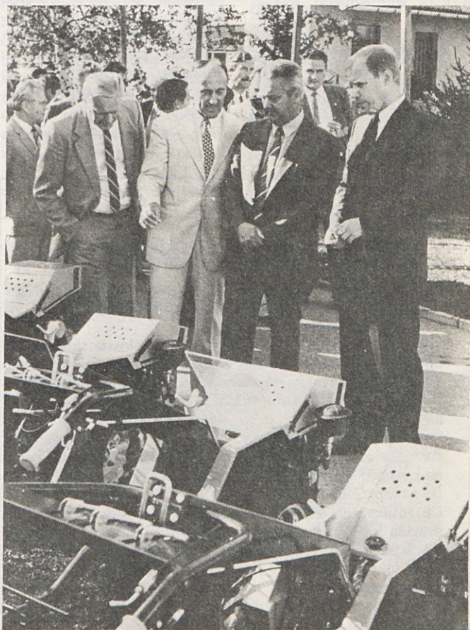
Sreča v zelenju in cvetju – Na Muti je bila od 3. do 7. septembra odprta tradicionalna razstava zelenega programa sozda Gorenje. Več o tem na 6. strani.

Takšno pobudo velja vsekakor podpreti, saj je naš cilj predvsem izpolnitev vseh proizvodnih, zlasti pa izvoznih obveznosti. V uresničitev tega cilja moramo vložiti vsa naša prizadevanja. Od tega je odvisen naš razvoj, od tega so nenazadnje odvisni tudi naši osebni dohodki.