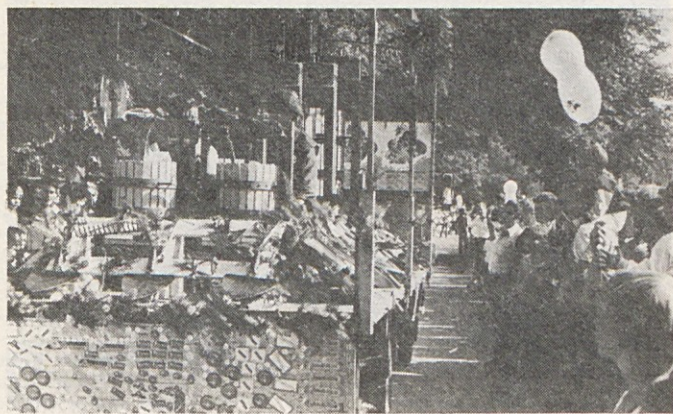
Sprevod cvetja si je na Muti ogledalo nekaj tisoč obiskovalcev