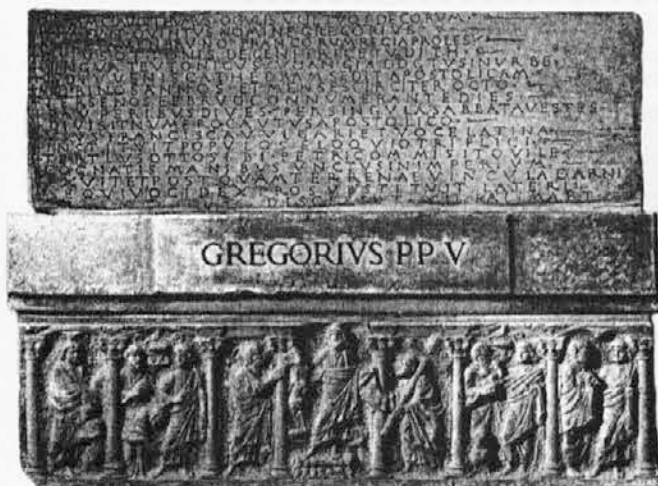
SARKOFAG papeža Gregorja V.

Karantanski papež je umrl nenadoma, verjetno zaradi malarije. Pokopali so ga pod cerkvijo sv. Petra in mu pozneje izdelali lep sarkofag, v katerem počiva še danes. Nad sarkofagom