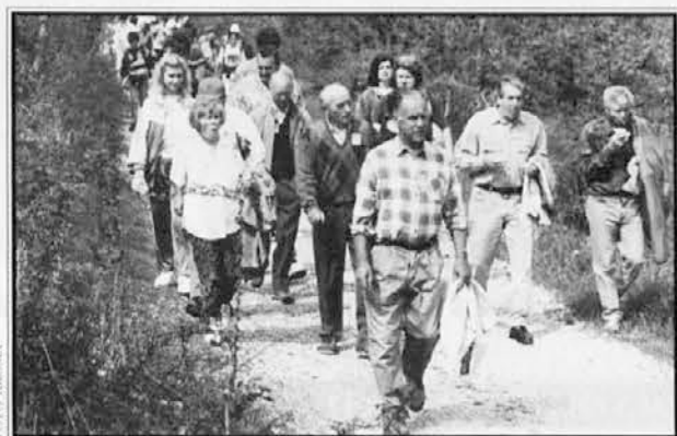
POHODA se je udeležilo veliko število ljudi

Kljub negotovemu vremenu se je v nedeljo, 28. aprila, veliko ljudi udeležilo 3. pohoda prijateljstva Mavhinje-Gorjansko, ki ga je priredilo športno-kulturno društvo Cerovlje-Mavhinje v sodelovanju z občinama Devin - Nabrežina in Komen ter z vaško skupnostjo Gorjansko. Poleg občanov z obeh strani meje so bili prisotni tudi ljudje iz drugih, bolj oddaljenih krajev. Pohod prijateljstva je namreč eno tistih srečanj, ki so med ljudmi zelo priljubljena in katerih osrednji pomen je v združevanju ljudi ne glede na državne meje.