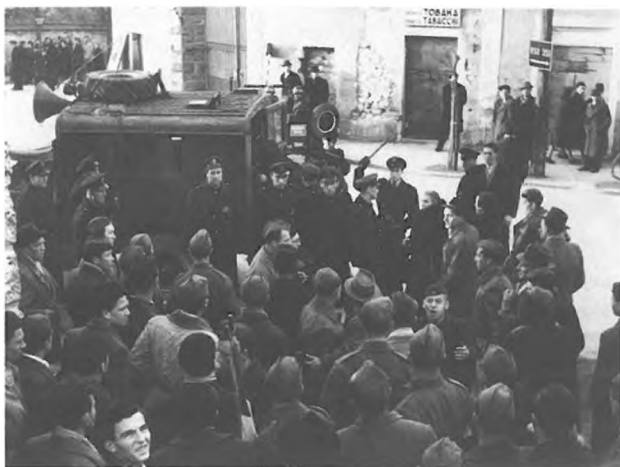
Protestni shod na Opčinah proti ZVU, ki je ukrepala proti osumljenim izvajalcem aretacij in usmrtilcev maja 1945. 4. januar 1948.

Procese proti slovenskim partizanom za dogajanja med vojno so poleg zavezniških vodile tudi italijanske oblasti na Goriškem, potem ko je bilo območje vrnjeno k Italiji, in to kljub zakonu predsednika republike o amnestiji za borce proti fašizmu iz leta 1946. Nekatere so celo obsodili na dosmrtno ječo. 215