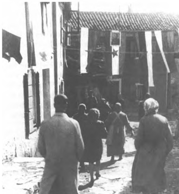
Škedenjčani se zbirajo za protestno manifestacijo proti ravnanju civilne policije, 19. marec 1946.

ski sveti, kar je pomenilo, da so bili učitelji, vsaj večina, naklonjeni SIAU. Za to območje je bilo značilno razpoloženje, o kakršnem poročajo iz Hrvatinih: »V Hrvatinih, ki imajo po podatkih statističnega odseka za NZ pri okrajnem NOO 254 Italijanov in 110 Slovencev, hodi velika večina slovenskih otrok v italijansko šolo. Vaščani so se zmenili, da bodo hodili v vaško šolo, ki je italijanska, tako Slovenci kot Italijani, vsi pa bodo hodili v večerne tečaje za slovenščino, tako Slovenci kot Italijani. Slovenci v tej vasi so po večini le slovenskega pokoljenja ter znajo le še slabo slovensko. Večerni tečaj se pa še ne vrši, ker ni učitelja.« 97