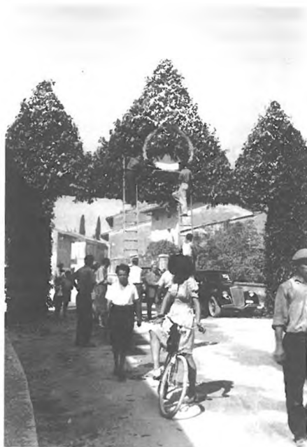
Solkan ob priključitvi k Jugoslaviji 16. septembra 1947.

iz neizobraženih Slovencev. Obenem je iz tega, da ljudje niso obvladali knjižne slovenščine, zaključevala, da je Julijska krajina italijanska. Od ZVU so zahtevali enak ukrep, kot je bila ukinitiv protizidovskih zakonov. 521