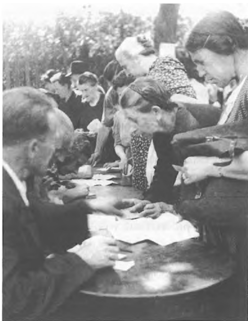
Splošna stavka projugoslovanskih organizacij julija 1946. Stavkajoči prejemajo pomoč.

Sklep o sprejemu francoske črte, ki je velik del Istre pripisovala Jugoslaviji, je sprožil nov val odseljavanja istrskih Italijanov. Njihovo naseljevanje v cona A je še bolj radikaliziralo že tako zaostrene politične razmere. Obenem so istrski priseljenci spremenjali etnično in tudi politično strukturo krajev, kamor so se naseljevali. Tako je v Tržiču, ki je bil večinsko naklonjen Jugoslaviji, zaradi odseljavanja delavstva in prihoda Istranov, zlasti Puljčanov januarja 1947, prihajalo do vse večje napetosti in do spopadov. Kot je ugotavljala ZVU, je položaj še radikaliziralo dejstvo, da je bila usoda Tržiča znana in je bilo samo vprašanje časa, kdaj se bo tudi dejansko vključil v Italijo. Teroristična aktivnost proitalijanov je naraščala tudi na delu Goriške, ki je ostajal pod Italijo. 93