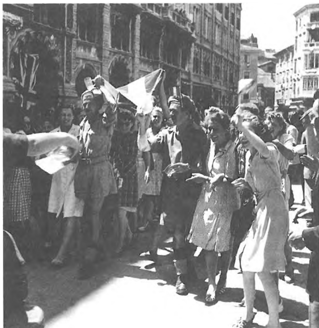
Veselje Italiji naklonjenih Tržačanov ob vzpostavitvi Zavezniške vojaške uprave 12. junija 1945

li zase, zanikali Slovincem in Hrvatom. Izhodišče njihovih zahtev je bila teza o večvrednosti naroda z visoko kulturo, ki je imel večje, poleg temeljnih še posebne zgodovinske pravice. Šlo naj bi za skoraj biološko pravico do narodnostne zavesti, ki je postala privilegij in dar, ki jo je lahko prinesla le kultura in je druga stran naj ne bi imela. 98 Poudariti pa je treba, da sta se nasprotni strani, obe sta zahtevali območja, na katerih so živeli tudi drugi, v svojih zahtevah oz. pravicah razlikovali v enem bistvenem izhodišču. Medtem ko slovenske (jugoslovanske) zahteve, če izvzamemo nekatere medvojnne predloge, ki pa niso postali uradni, niso segle prek slovenskih etničnih mej, so bile zahteve po območju, ki je bilo k Sloveniji pridruženo leta 1947 in do katerega Italija nikdar v zgodovini, če ne posežemo več kot tisoč let nazaj, ni imela nobenih pravic, zgolj imperializem.