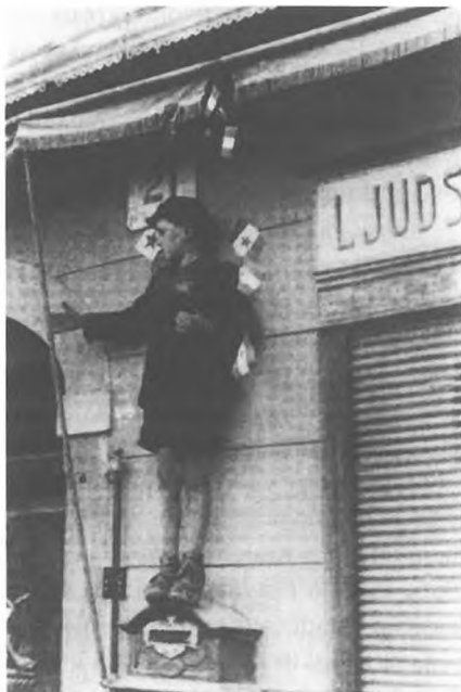
Politika kot igra

suverenosti na tem območju. Ob tem so dodali: «Bilo pa bi v nasprotju z vsemi zemljepisnimi, gospodarskimi, političnimi načeli in načeli pravičnosti odrezati Trst od Istre ali pa ločiti Istro in Trst od naravnega zaledja, ali pa od območja, po katerem potekajo transportne poti do italijansko–avstrijsko–jugoslovanske meje.» 20