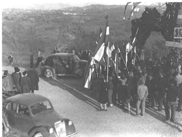
Sprejem mednarodne razmejitvene komisije na Krasu, marec 1946.