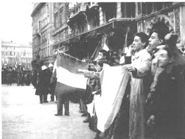
Proitalijanske demonstracije v Trstu ob obisku mednarodne razmejitvene komisije marca 1946.

V taboru, ki je zahteval ohranitev Italije, je poleg CLNG, ki je bil osrednji politični organ, delovalo več nestrankarskih oziroma nadstrankarskih organizacij, med katerimi sta bili najmočnejši Narodna zveza (Lega nazionale, LN) in sindikalna Delavska zbornica (Camera del lavoro, CGIL). Veliko članov sta imeli tudi Narodna zaveza italijanske mladine (Intesa giovanile nazionale italiana, IGNI) in Zveza italijanskih študentov (Associazione studenti italiani, ASI). Samo v Trstu naj bi imele te nadstrankarske organizacije skupaj približno sto tisoč članov. Te organizacije, in ne CLNG, so pri pripravah Italiji naklonjenih pred prihodom razmejitvene komisije, ki so potekale v prvih mesecih leta 1946, prevzele njihovo organizacijo. 152 Tudi proitalijanske manifestacije ob prihodu razmejitvene komisije konec marca 1946, na katerih je po italijanskih podatkih v coni A sodelovalo sto osemdeset tisoč ljudi in v katerih se je proitalijanski tabor po moči prvič izenačil z nasprotnim, naj bi organizirala zlasti Narodna zveza. Kot poročajo italijanski vladni viri, se je vanjo spontano vključilo na desetine tisočev ljudi, medtem ko je imel CLNG osem do devet tisoč članov. 153 Na teh manifestacijah so vpili tudi fašistične parole, ki so -besnele od italijanskega šovinizma- , kot se je slikovito izrazila Lidija Šentjurec. 154