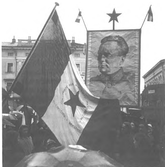
Manifestacija za priključitev k Jugoslaviji v Tržiču, 8. marec 1946.

CLNG se na tržaško delavstvo ni obračal s protikomunističnimi stališči, ampak so komunizem še poudarjali, skušali pa so ga odvrniti od povezave komunizem = Jugoslavija: «Tržaški delavci, če vam je všeč komunizem, kar vpijete: Živel komunizem, živel Lenin, živel Stalin, živel Togliatti ali Ercoli in če hočete tudi živel Tito. Toda če ste komunisti, zakaj vpijete Živel Trst v federativni Jugoslaviji! To ni komunizem, ampak pravi nacionalizem. Da sta Trst in velik del Istre italijanska, vedo vsi, vključno s Titom. Zakaj raje torej ne vpijete: Snemite maske! ... Rešitev Julijske krajine vključno s Furlanijo se imenuje autonomija.» 49