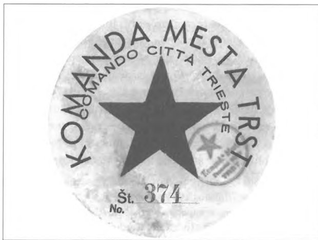
Automobilska nalepka Komande mesta Trst.

Večina ljudi si je po dolgoletni vojni želela predvsem normalno, mirno življenje. 27 Pri tem Jugoslovani, tako proitalijanski Akcijski odbor Julijske krajine, niso bili uspešni, saj naj bi bil gospodarski položaj v Trstu katastrofalen. Odbor niso presenetile takšne razmere, ker so ti »osvojevalci bili ljudje, ki so prišli iz gozda in so bili prvič v stiku s civilizacijo». 28 Jugoslovanska oblast se je zavedala, da je bila vzpostavitev normalnih razmer predvsem politično vprašanje, ker bi slabe razmere dokazovale, da Jugoslavija Trsta ni sposobna preživeti. Tudi zato je skušala čim hitreje vzpostaviti normalno delovanje tovarn in drugih obratov ter infrastrukture; večina manjših