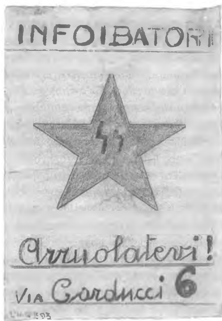
Letak, ki jugoslovanske oblasti enači z nacističnim okupatorjem.

Nezadovoljstvo proitalijanskih krogov je v Trstu izbruhnilo 5. maja 1945. Nekateri proitalijanski viri poročajo o kar štirideset tisoč udeležencih demonstracije, kar je gotovo pretirano, saj je bilo v takratnih razmerah v Trstu nemogoče zbrati v tako kratkem času toliko ljudi. Jugoslovanska vojska je na demonstrante streljala, pet ljudi ubila in nekaj deset ranila. CLNG je med drugim posredoval tudi v Rimu pri zavezniških oblasteh. 90