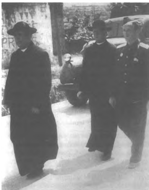
Škof Antonio Santin se po napadu nanj med obiskom v Kopru vrača v Trst, junij 1947. Spremljata ga pripadnika Narodne zaščite.

Proti jezikovnim in kulturnim zahtevam je nastopal tudi del Slovencev samih. Slovenskim šolam najbolj nasprotni naj bi bili, kot piše v elaboratu o Beneški Sloveniji leta 1948, «baš slovenski učitelji, to se pravi tisti narodni odpadniki, ki jih Italija vzgaja v učiteljšišču v Špetru. Agitatorji zoper slovenske zahteve so župani in občinski tajniki, trgovci in bogatejši sloji – sami ljudje slovenske krvi, ki so se iz enega ali drugega vzroka odtujili svojemu narodu.» 558 Ti «rinegati» naj bi bili, kot poročajo slovenski viri, celo bolj goreči kot Italijani ter po mentaliteti pravi fašisti in naj bi ob podpori furlanske duhovščine izvajali «grozen duševni teror na vse slovenske zavedne ljudi. Njihov kaplan, po rodu Slovenec, je aktiven v ščuvanju proti pristinim Benečanom, okrog sebe zbira ozopovce in fašiste, piše v Tricolore, ki izhaja z vednostjo karabinjerjev. Res strašno je živeti v tem duševnem ozračju. Kot so mi dejali kmetje, pitajo naše ljudi z večnimi 'banditi'. Fizično jih sicer ne pretepajo, a so jim vedno za petami, na vsakem oglu je karabinjer, tajni domači policist, ki je bil do včeraj fašist.» 559