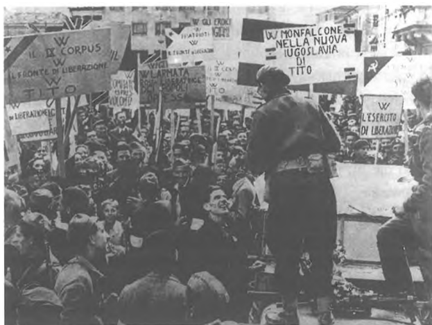
Manifestacija za priključitev Tržiča k Jugoslaviji, verjetno poleti 1945.

tudi dovoljenje lokalne partijske organizacije, kar sedaj ni bilo potrebno. 71 Tudi italijanske oblasti so julija 1947 ugotavljale, da je SIAU na območju Tržiča izgubila vpliv, ker so vodje odšli v cono B ali postali filoitalijani. Vendar naj bi se Slovenci vključevali v partijo in s tem omogočili, da je jugoslovanska stran ohranila del svojega vpliva. 72 Jugoslavija je s tem preseljevanjem delavstva tudi marsikaj pridobila, saj je na napade zaradi italijanskih odhodov lahko odgovarjala s priseljevanjem njej naklonjenih Italijanov. Zato je bila propaganda za odhajanje v Jugoslavijo verjetno tudi del načrtne jugoslovanske politike.