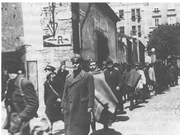
Skupina italijanskih in nemških vojnih ujetnikov na tržaških ulicah maja 1945.

pregledala tudi delegacija mednarodnega Rdečega križa. Splošni zaključek je bil, da zadovoljujejo človekove pravice. Izpustitve tudi deportiranih iz Julijske krajine so bile od julija 1945 vsakdanje. 222