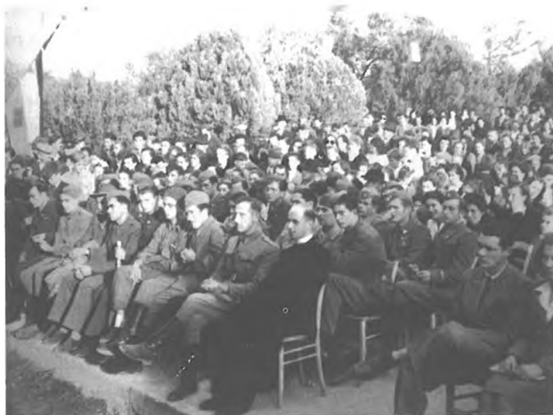
Zborovanje v Sežani leta 1945.