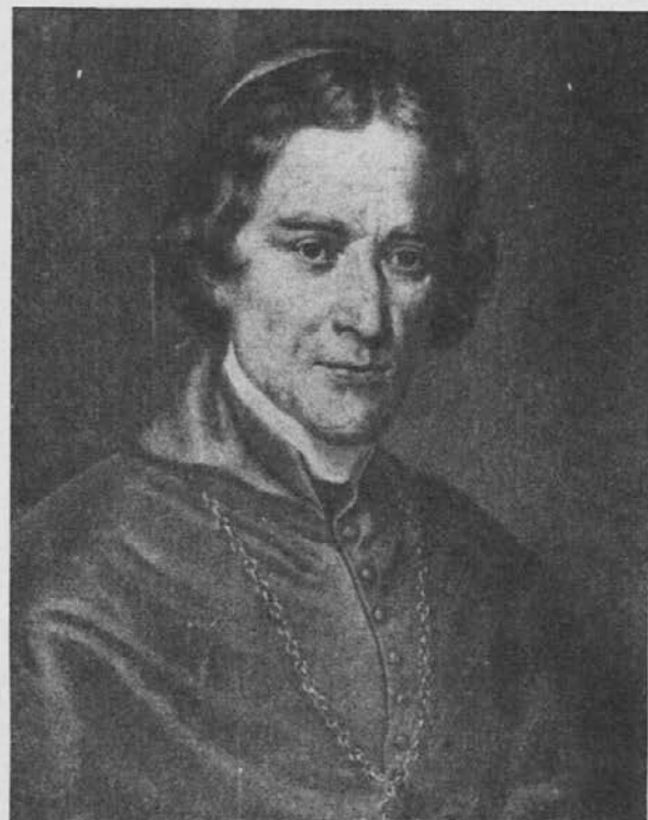
FRIDERIK IRENEJ BARAGA, misijonski škof med Indijanci Čipvejskega in ottavskega plemena. Rojen 29. jun. 1797, Mala vas, župnija Dobrnič, umrl 19. jan. 1868, Marquette, Mich., ZDA, poln izrednih kreposti.