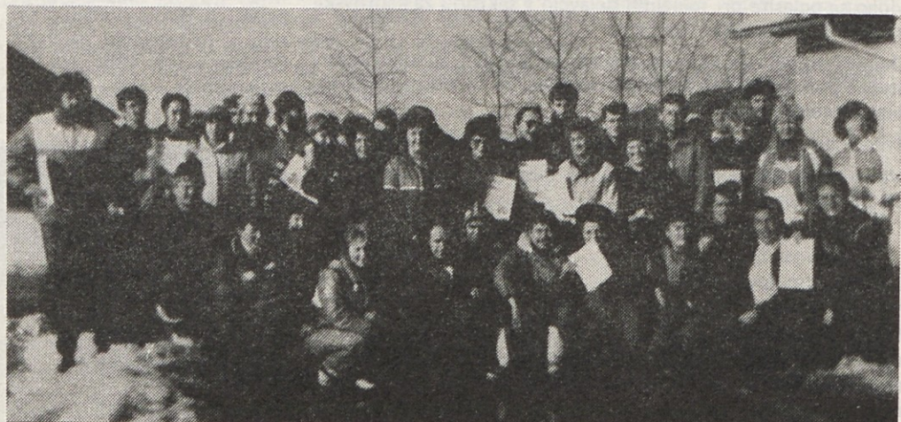
Nedeljsko prvenstvo Gorenja v sankanju za leto 1986 je izredno lepo uspelo. Letos presenečenje ni bilo. Zmagali so tisti, ki so večji tudi tega lepega športa.

V blagajni vzajemne pomoči lahko planinci že plačajo članarino za leto 1986 in dobijo tudi marke.