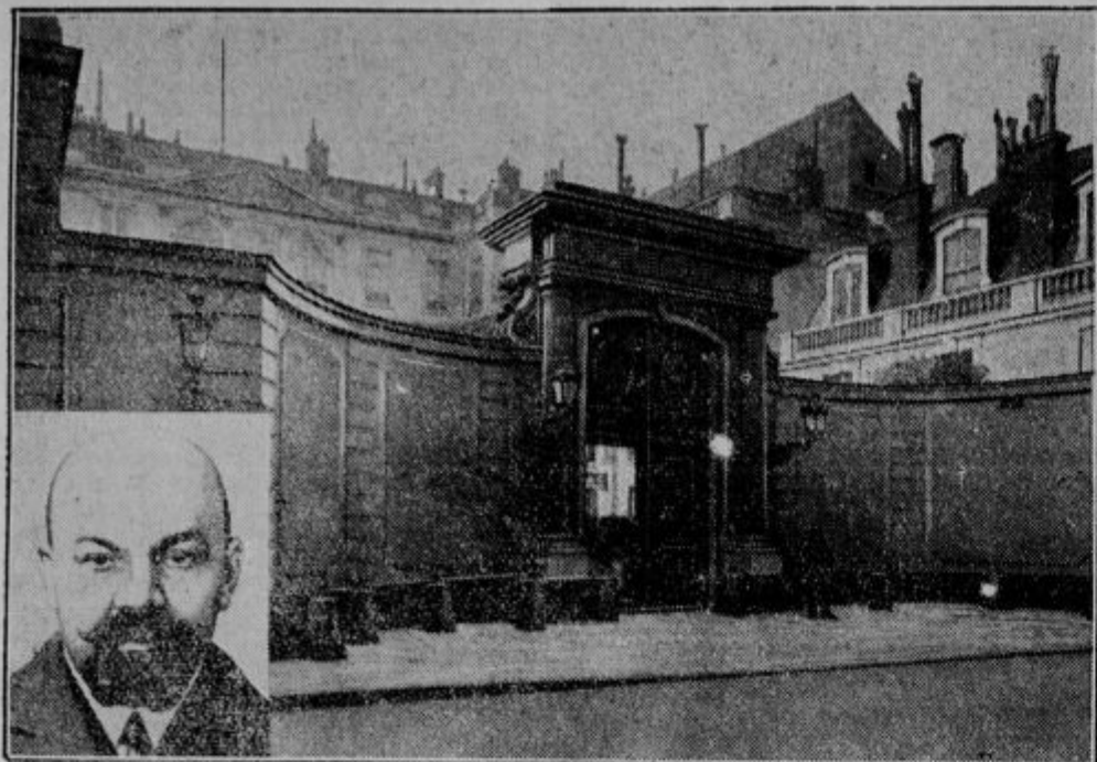
Sovjetsko poslaništvu v Parizu. — Na levi general Kutjepov.