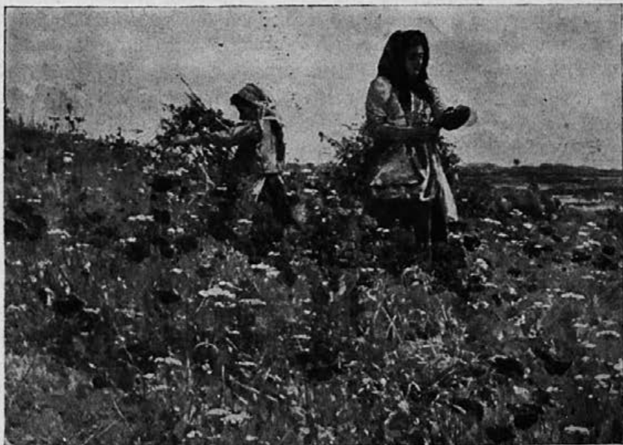
Cvetje v poletju.

Uka fant in poje, deklica rdi, nageljček pa z okna mu v pozdrav dehti.