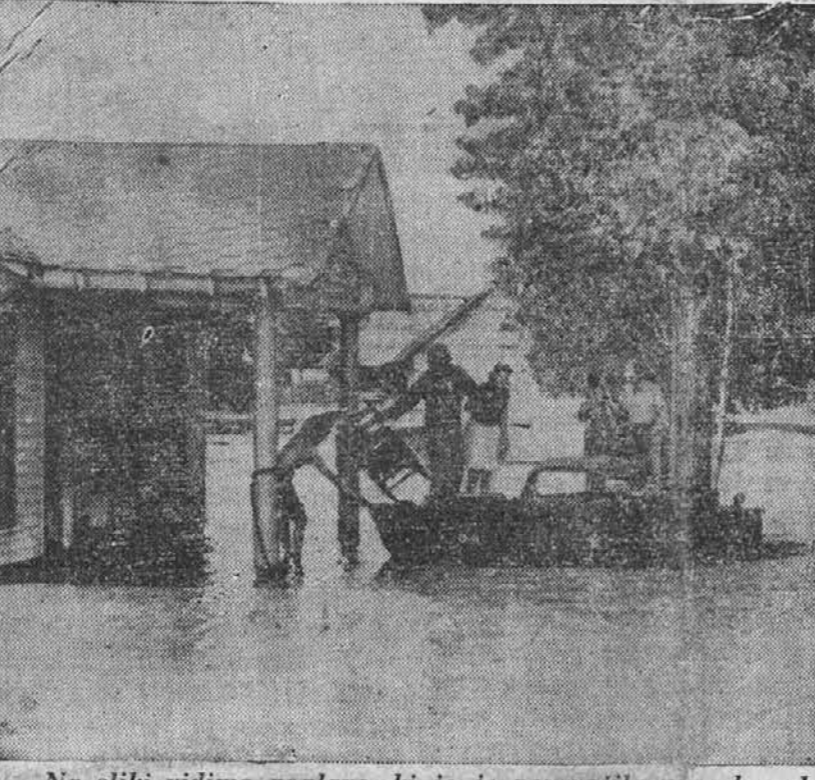
Na sliki vidimo poplavo, ki jo je povzročila narasla reka Arkansas. Onkraj čolna je videti streho in gornji del avtomobila, ki tiči pod vodo.