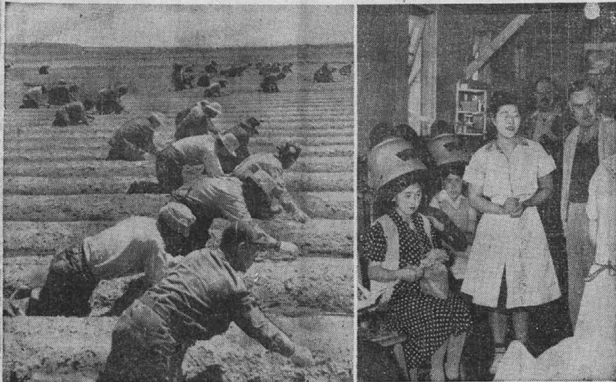
Na gornjih dveh slikah vidimo prizore iz življenja ameriških Japoncev, ki so naseljeni v posebnih centrih. Moški na levi plevejo na polju, na desni pa so Japonke v svojem lepotilnem salonu.

škotskega volčaka. V pobotnicah tajnega fonda je prirasel nov D . . . 90 K. Tista spaka je igrala ulogo doge.