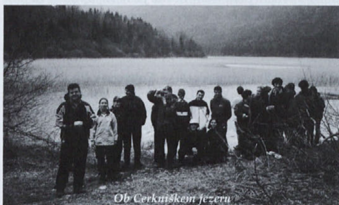
Ob Cerknjanskem jezeru

Planinsko društvo Žetale je 20.04.2002 organiziralo prvi izlet, pohod na Slivnico. Kljub mračnim in deževnim vremenskim napovedim in odjavam nekaterih vremensko strašljivih planincev, smo ob šesti uri zjutraj krenili proti Cerknjanskemu jezeru. V geografskem pogledu nas je pot vodila skozi tri makroregije, saj smo pohod začeli v gričevnatem delu panonskega sveta, nadaljevali skozi alpski svet, kjer smo lahko občudovali v nebo kipeče vrhove Kamniško- Savinjskih Alp in verigo vrhov ter slemen na območju trojanske antiklinale. Proti jugu pa smo iz pokrajin alpskega in panonskega sveta prešli v pokrajine dinarskega sveta, katerega Notranjsko podolje s 70 km2 velikim Cerknjanskim jezerom in 1114 metrov visoko