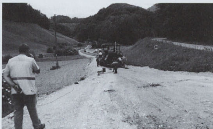
Po asfaltirani cesti od Marinje vasi

Pred leti smo postali samostojna občina Žetale. Pripravili smo prioritetni vrstni red investicij v posameznih katastrskih občinah. Vaški odbor je pripravil plan investicij za katastrsko občino Nadole in določil vrstni red za njihovo realizacijo.