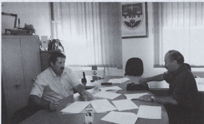
Podpis pogodbe za izgradnjo vežice

onemogočala gradnjo vežice na samem pokopališču, zato je bilo potrebno razmišljati o gradnji vežice izven pokopališča. Lastnik zemljišča, kjer bi po vsesplošnem prepričanju bil primeren prostor za gradnjo mrliške vežice, je bil Župnijski urad Žetale. Pogajanja za zemljišče na jugozahodnem vogalu pokopališča so bila dolga. Na koncu so le prevladali argumenti, da v Žetalah potrebujemo objekt, v katerem se bomo lahko na dostojen in spoštljiv način poslovili od naših najdražjih. Občina Žetale je na podlagi kupoprodajne pogodbe odkupila od Župnijskega urada Žetale zemljišče v izmeri 6 arov. Vrednost zemljišča je znašala 1.422.762,00 tolarjev. Polnopravno lastništvo zemljišča je omogočilo občini Žetale, da je lahko začela pridobivati vso potrebno lokacijsko in gradbeno