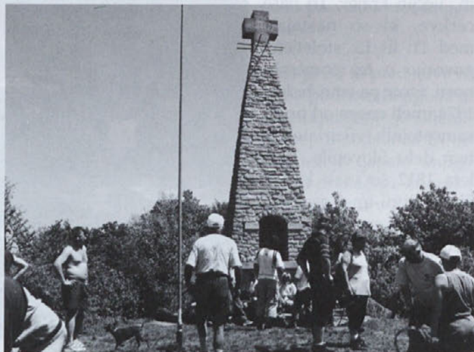
Dokaz, da smo dosegli cilj