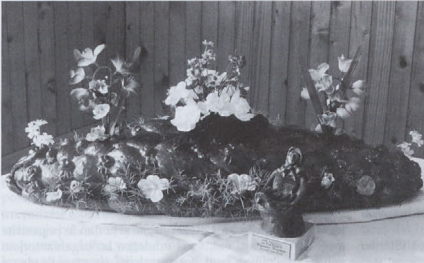
Ena izmed večkrat nagrajenih pletenic oziroma svatovskih štruc