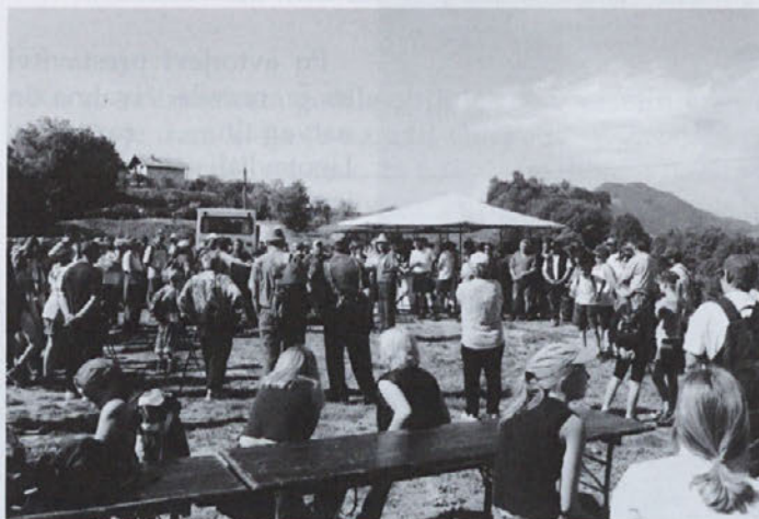
Donačka gora v ozadju - cilj Skokovega pohoda

PD Žetale se je 18.05.2002 pridružilo tudi številnim planincem na četrtem tradicionalnem Skokovem pohodu na Donačko goro. Pohod je organizirala restavracija Gastro pod vodstvom PD Hakl. Ob deveti uri zjutraj smo iz Kočic skupaj s 300 planinci iz različnih društev krenili proti „haloškemu Triglavu“. Po nekaj-urni hoji in številnih postankih smo prišli na vrh Donačke gore, kjer se nam je zaradi lepega vremena odprl pogled na Dravsko polje, Haloze, Boč in Posotelje. Donačka gora ali tudi Rogaška gora je v literaturi in med pohodniki poznana po redkih rastlinah, po cerkvi Sv. Donata (511 m) iz 18. stoletja, po kateri je dobila tudi ime in po čarovniških shodih, ki so v srednjem veku burili ljudsko domišljijo. Danes pa je zaradi svoje izstopajoče podobe priljubljena izletniška in planinska točka.