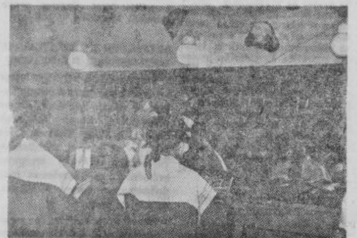
Tudi v frizerskem salonu je vedno polno

nje, ko so v obratu splošno računali s par sto tisočaki, sedaj pa grede brez njihove pridne roke pošteno zasluženi milijončki. Obrat, ki se je pri enem oddeleku z dvema uslužbenecoma razvil v sedanjih obrat z 9 uslužbenecih in ki pridno delajo ter dobro gospodarijo, je lahko za vzgled vsem, ki mislijo na usluž-