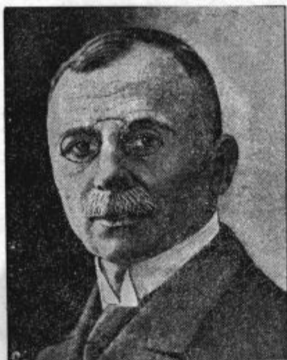
Dr. Ante Trumbić, zaslužen jugoslovanski politik in še izza časa Avstrije znan borec za jugoslovansko misel, je sprejel na dr. Mačkovi listi kandidaturu za mesto Zagreb.

Po cenitvah strokovnjakov bomo letos izvozili samo iz Slovenije okrog 700 vagonov jabolk, in sicer v glavnem iz okolice Maribora, Slovenskih goric, Prekmurja in Murskega polja, kjer je bila letos sadna letina zelo obilna. V nekaterih drugih predelih Slovenije letina ni tako ugodna. Ker je tudi v inozemstvu letošnja sadna letina razmeroma slaba, je po jabolkih povpraševanje vedno bolj živahno. Izkupiček za izvožena in doma prodana jabolka bo znašal letos v Sloveniji okrog 25 milijonov din.