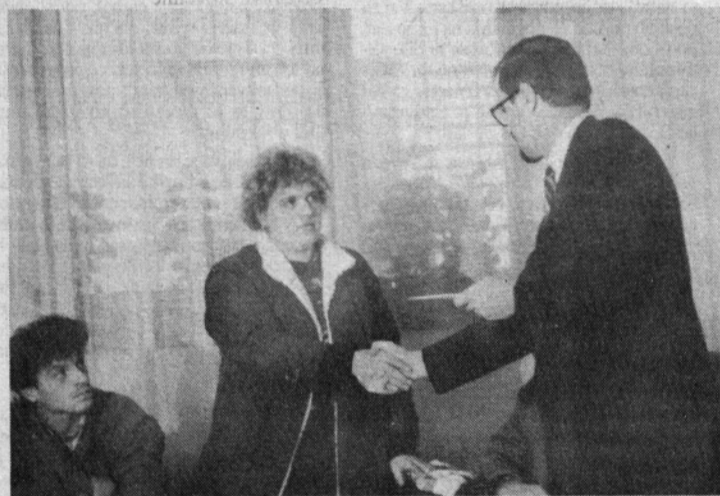
Predstavniki Gorenja so krepko priskočili na pomoč svojim prizadetim delavcem