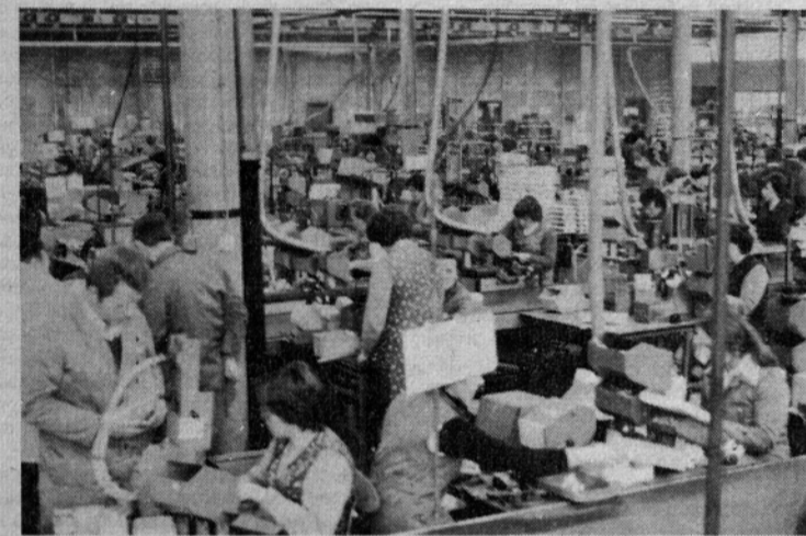
Gorenje Mali gospodinjski aparati pred desetimi leti...