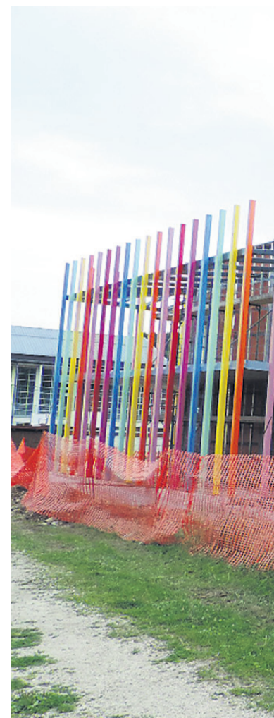
Vrtec je trenutno v četrti fazi izvajanja.

Nastalo finančno zagato je občina želela rešiti s kreditom, dogovori z bankami pa naj bi po zagotovitvi župana