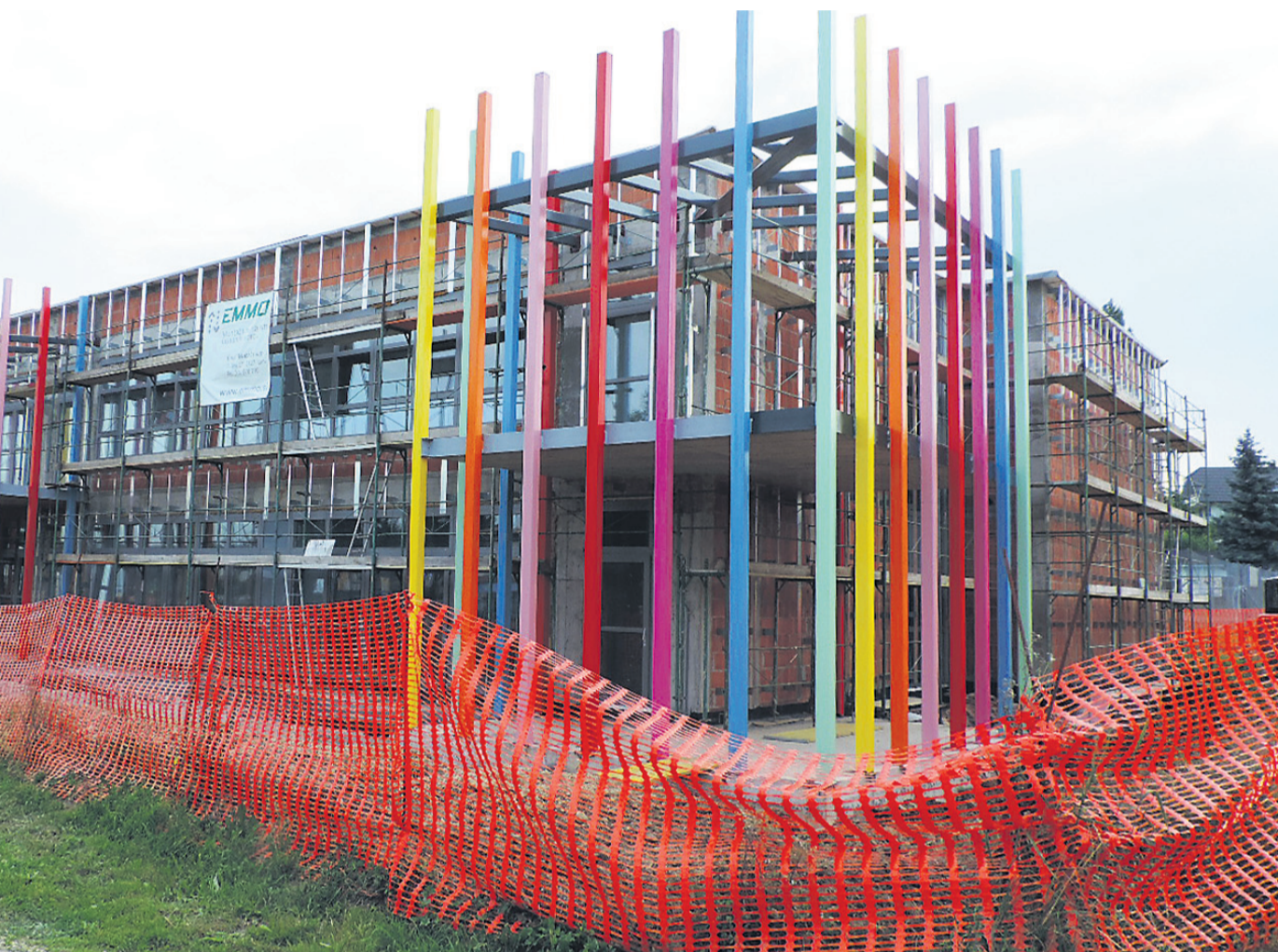
Dela potekajo z manjšim tempom, v kratkem pa se bodo zaradi pomanjkanja sredstev najverjetneje morala prekiniti.

ga sedemdelčnega vrtca, vrednega 1.461.500 evrov, morala začasno prekiniti. Zmanjkalo ji je namreč lastnih sredstev v višini dobrih zarja naj bi dogovori z bankami sicer že potekali, vendar naj bi kredit najeli šele naslednje leto. Vprašanje pa je, ali bo občina zaradi čati evropska sredstva v višini 401.601 evro.