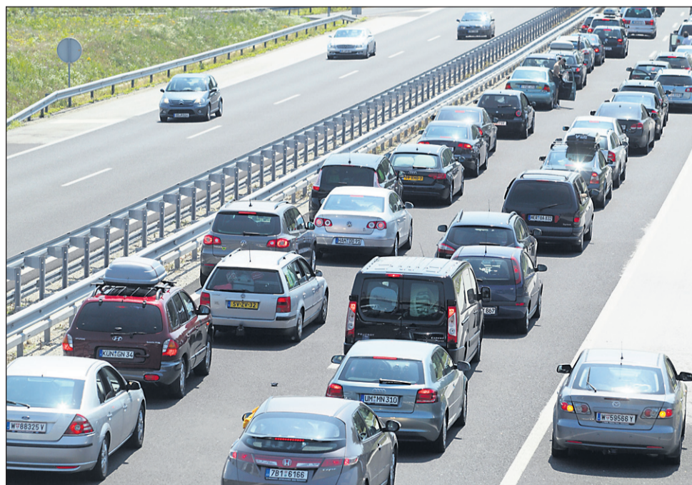
V prvih šestih mesecih letošnjega leta je slovensko-hrvaško mejo na Gruškovju prečkalo 1.029.029 osebnih vozil oziroma za 13 % več kot v enakem obdobju lani, ko je mejni prehod v prvih šestih mesecih leta prečkalo 907.477 vozil.

»Z največjo gostoto prometa se na mejnem prehodu Gruškovje tradicionalno srečujemo v mesecih julij in avgust, ko prečka mejni prehod več kot pol milijona vozil mesečno. Dnevne konice dosežejo do 35.000 vozil,« so dejali na PU Maribor. V lanskem letu je bila gostota prometa najvišja v avgustu, ko je mejni prehod prečkalo 607.767 osebnih vozil, 31.302 tovornih vozil ter