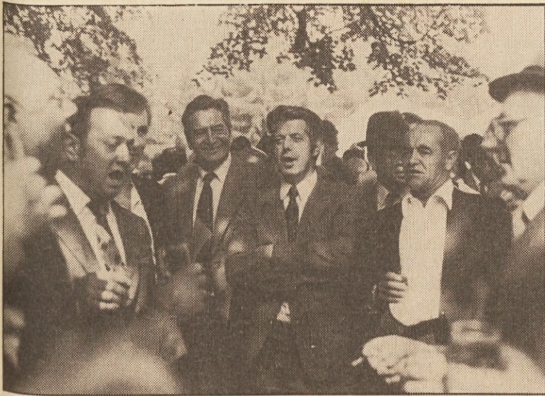
Kot vsako leto, so se tudi letos zbrali domači pevci pod lipami ter zapeli domače, slovenske pesmi