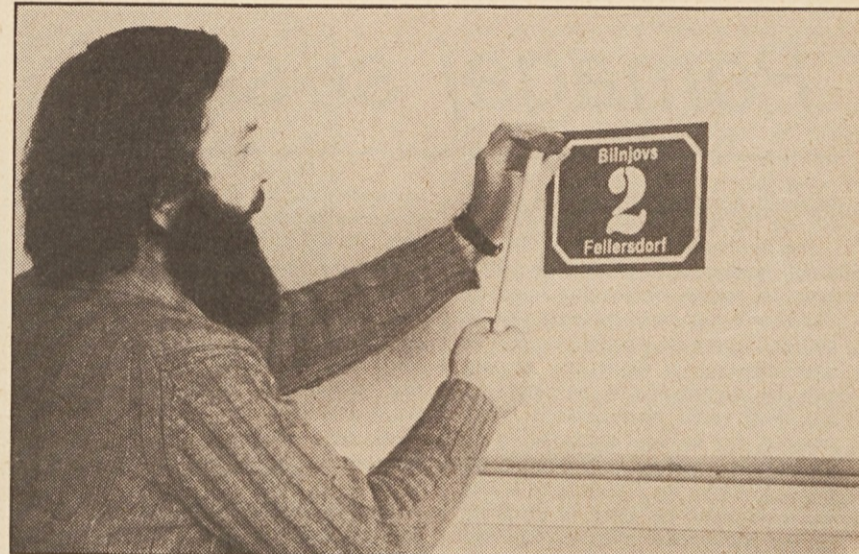
Že pred leti je KDZ začela z akcijo za dvojezične hišne napise. Sedaj jo hoče nadaljevati. (Glej tednikov komentar!)