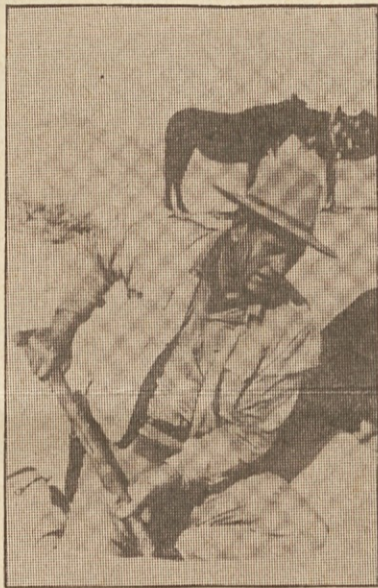
„Mesto izgubljenih“ — glavno vlogo igra John Wayne (24. 9. ob 22.20 — FS 2)

NEDELJA, 26. septembra: 11.00 Ura tiska — 12.00 Vizualna izobrazba — 15.15 Lefty — 16.45 Cesar in slavček — 17.10 Risanka — 17.40 Klub seniorjev — 18.30 Emmerich Kalman — 19.00 Avstrija v sliki —