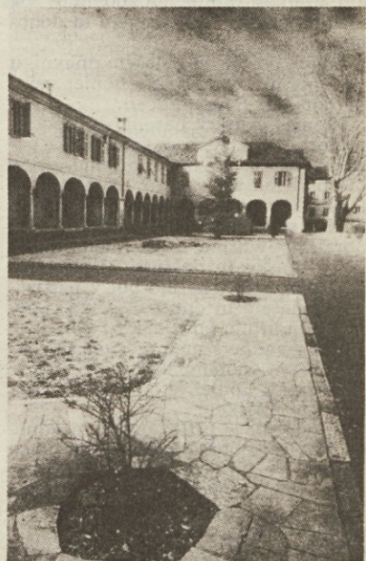
Ena od razstavljenih fotografij v goriškem avditoriju

Ob odprtju razstave so prireditelji predstavili tudi knjigo »Gorizia da scoprire, Gorizia da salvare«, v kateri so zbrali vse sprejete fotografske pri-spevke.