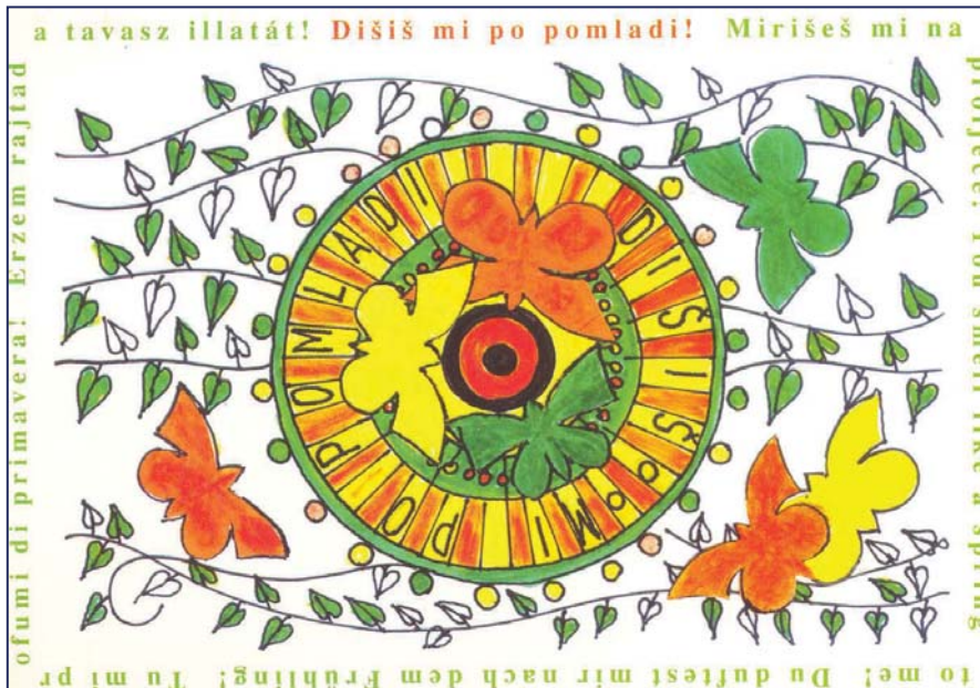
Slika 1. Kartica Felix: Dišiš mi po pomladi

V teku šolskega leta učenci pod vodstvom mentorja izvajajo aktivnosti programa Vzgoja za nekajenje in natečaja. Zaključek vseh aktivnosti je na končni regijski prireditvi z naslovom Dišiš mi po pomladi v maju. Prireditev je obogatena z razstavo izdelkov šolarjev (Slika 2).