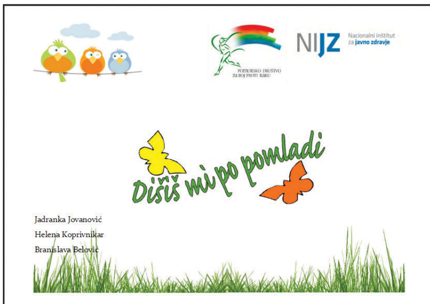
Slika 3: Naslovnica e- publikacije Dišiš mi po pomladi

Zaključna regijska prireditvev Dišiš mi po pomladi je tradicionalna. Vedno poteka ob Svetovnem dnevu brez tobaka na izbrani pomurski osnovni šoli v soorganizaciji gostujoče osnovne šole, Območne enote Nacionalnega inštituta za javno zdravje in Pomurskega društva za boj proti raku. Poudarek v programu prireditve je na scenografiji, vodenju prireditve in kulturni obogatitvi programa. Razstava izdelkov je del scenografije, ki ima iz leta v leto rdečo nit, je preprosta in prepoznavna in jo je možno dopolniti s izdelki šolarjev. Na prireditve so povabljeni vsi sodelujoči učenci, njihovi mentorji, predstavniki nevladnih organizacij, Zavoda za šolstvo RS, Zveze slovenskih društev za boj proti raku, predstavniki lokalnih skupnosti in medijev. Postavitev razstave poteka dan pred prireditvijo, kjer se na inovativen način tematsko predstavi razstava. Prireditve obsega kulturni program, predstavitev gostujoče šole ter podelitev priznanj, pohval in nagrad. Udeleženci si po končanem programu v prijetnem vzdušju ogledajo razstavo, na kateri lahko učenci spoznajo in vidijo sporočila svojih vrstnikov.