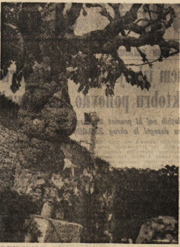
MOTIV S KRASA

Maga je naraščajoče ljudsko nezadovoljstvo hotel rešiti s pritegnitvijo nasprotnikov v vlado - Zahteve sindikatov in ljudstva - Nasprotovanje tujim oporiščem