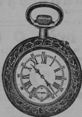
Srebrna ura 4.—, 5.50, 6.— gld. Anker ure od 7 do 12 gld. Jamči se 3 leta.