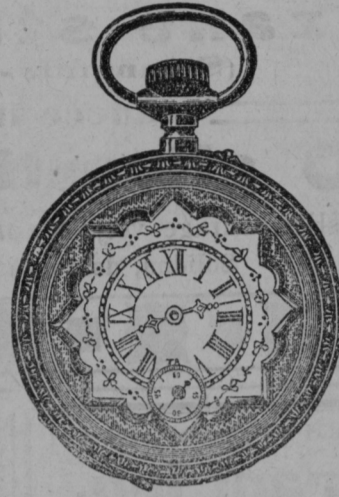
Srebrnaura 5.50, 6.—, 6.50 gld. Anker s 15 kamni 8 do 12 gld.