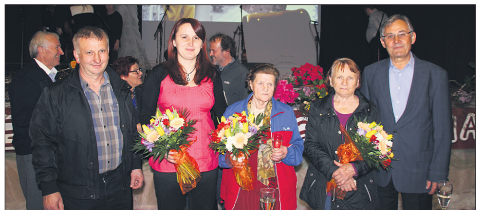
Letošnje nagrajenke v družbi župana in predsednika TD Makole