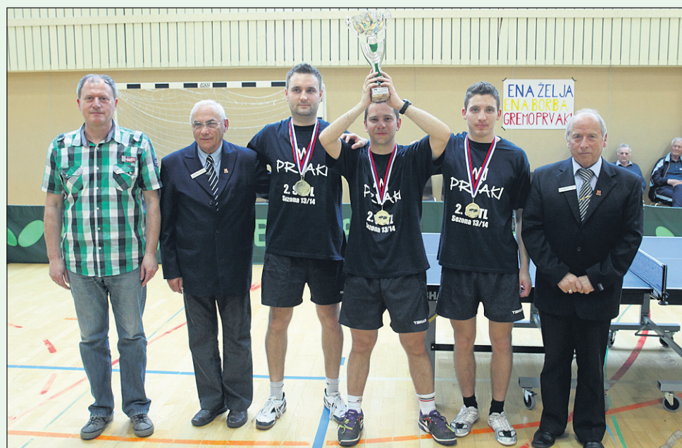
Ekipa iz Cirkovc je z napredovanjem v 1. ligo dosegla največji uspeh v njihovi zgodovini.