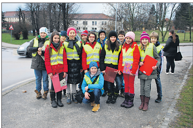
Učenci 5. c razreda so poiskali rešitve, kako bi lahko bila Vodova ulica varnejša.

prometnega znaka »omejitev 40«, skupaj z redarsko službo merili hitrost avtomobilov, ob vsem tem pa še pridno reševa-