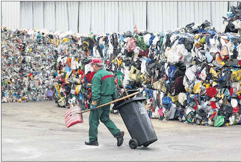
Mestni svetniki potrdili nižje cene za odpadke.

»Po objavljenem v Štajerskem tedniku, iz članka zelo jasno izhaja, za kaj gre v resnici, sem razbral, da gre še vedno za pocenitev, vendar ne v takšnem znesku, kot je zapisan v že omenjenem soglasju. Posledično sem začel izračunavati, kaj takšna odločitev pomeni za CERO Gajke. Pogledal sem v dokumente proračunskega sklada CERO Gajke, njegove prejemke in izdatke. Ker se v spremenjeni ceni upošteva zgolj najemnina za javno infrastrukturo, me kot svetnika zanima, kako se bodo v prihodnje zagotavljala sredstva za postavke proračunskega sklada CERO Gajke, če na položnici ne bo več prispevka za investicije. To je 11.000 evrov za odvoz odpadkov iz Budine, odškodnine za zmanjševanje kakovosti življenja v višini 40.000 evrov, odvoz po pogodbi za ČS Jezero v znesku 53.000 evrov, Športni park Budina v višini 200.000 evrov, večnamensko dvorano v Spuhlji v znesku 288.000 evrov, investicijsko vzdrževanje CERO Gajke v višini 123.500 evrov in še nekaj drugih postavk, po mojem izračunu v skupni višini 754.000 evrov. Se torej z novo položnico ustavljajo investicije v CERO Gajke oz. od kod se bodo vse te postavke, ki sem jih naštel, financirale glede na znesek najemni-