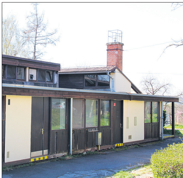
V objekt nekdanjega vrtca na Žigrovi ulici se bo po obnovi preselila ormoška knjižnica.