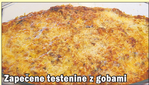
Zapečene testenine z gobami