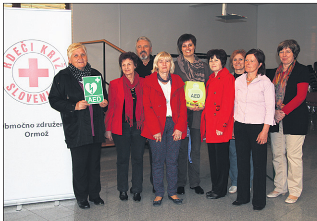
Člani KO RK Ormož so ponosni na novo pridobitev, ki lahko rešuje življenja.