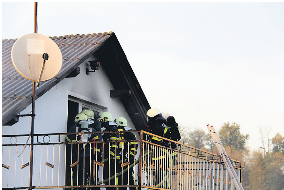
Oktober lani so ormoški gasilci izvedli vajo v realnih okoliščinah. Objekta, na katerih je potekala vaja, sta bila dejansko v ognju.

Operativni del izvajanja nalog gasilcev na ormoškem območju za lansko leto je predstavil poveljnik GZ Or-