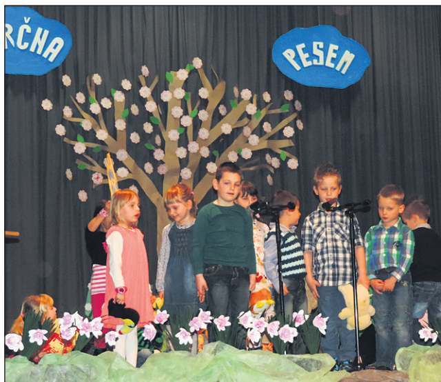
Na prireditvi, posvečeni vsem mamicam, babicam, očkom in dedkom, so nastopali tudi otroci iz vrtca Navihanček pri OŠ Središče ob Dravi.

Na prireditvi je nastopal tudi Dramski krožek OŠ Sre-