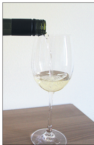
Ali se ormoškemu vinogradništvu obetajo boljši časi?