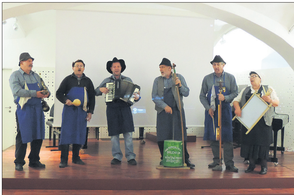
Künštne Prleki so s Prleško himno poskrbeli za glasen uvod v predstavitev Filmskega potovanja Künštne Prlekove med Muro in Dravo.