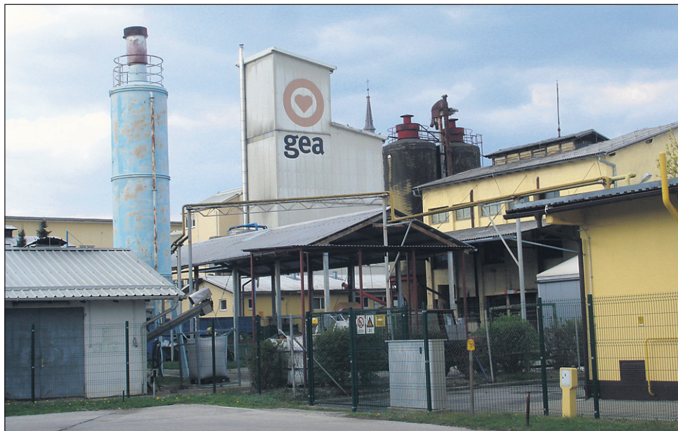
Slabši poslovni rezultat tovarne olj Gea gre pripisati tudi aktivnosti konkurenčnih podjetij, ki prihajajo iz globalnih trgov in so bila izjemno agresivna v pridobivanju tržnega deleža. Kljub temu je Gea lani poslovala z dobičkom v višini dobrih 77.000 evrov.

Slabši poslovni rezultat gre pripisati tudi aktivnosti konkurenčnih podjetij, ki prihajajo iz globalnih trgov in so bila