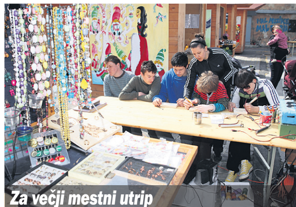
Za večji mestni utrip