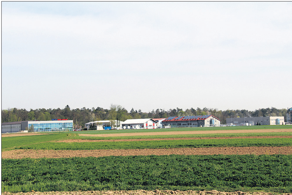
Na območju OC Novi jork naj bi zgradili regijsko odlagališče.