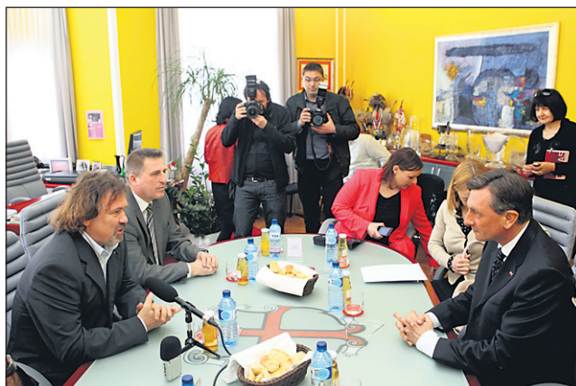
S sprejema v Mestni hiši na Ptuj