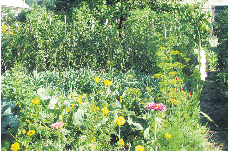
Vrt, poln cvetja in dišav, je zdrav vrt, ki ga je veselje tudi pogledati.

Vendar velja vpliv dobrih sosedov samo tam, kjer se prepletajo korenine, na sosednji gredi težav ni. Vedno pa je treba paziti, da večje rastline ne senčijo manjših, v poletni vročini pa naredimo obratno, solato, cvetačo, brokoli sadimo na primer v senco visokega fižola, da bodo bolje uspevali. Najpomembnejše pa je, da na vrtu vključimo čim več cvetja, nikakor naj ne manjkajo ognjič, žametnica in kapucinke, vendar pa so zelo pomembne tudi cvetoče ko-