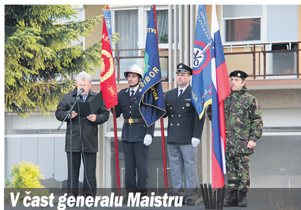
V čast generalu Maistru