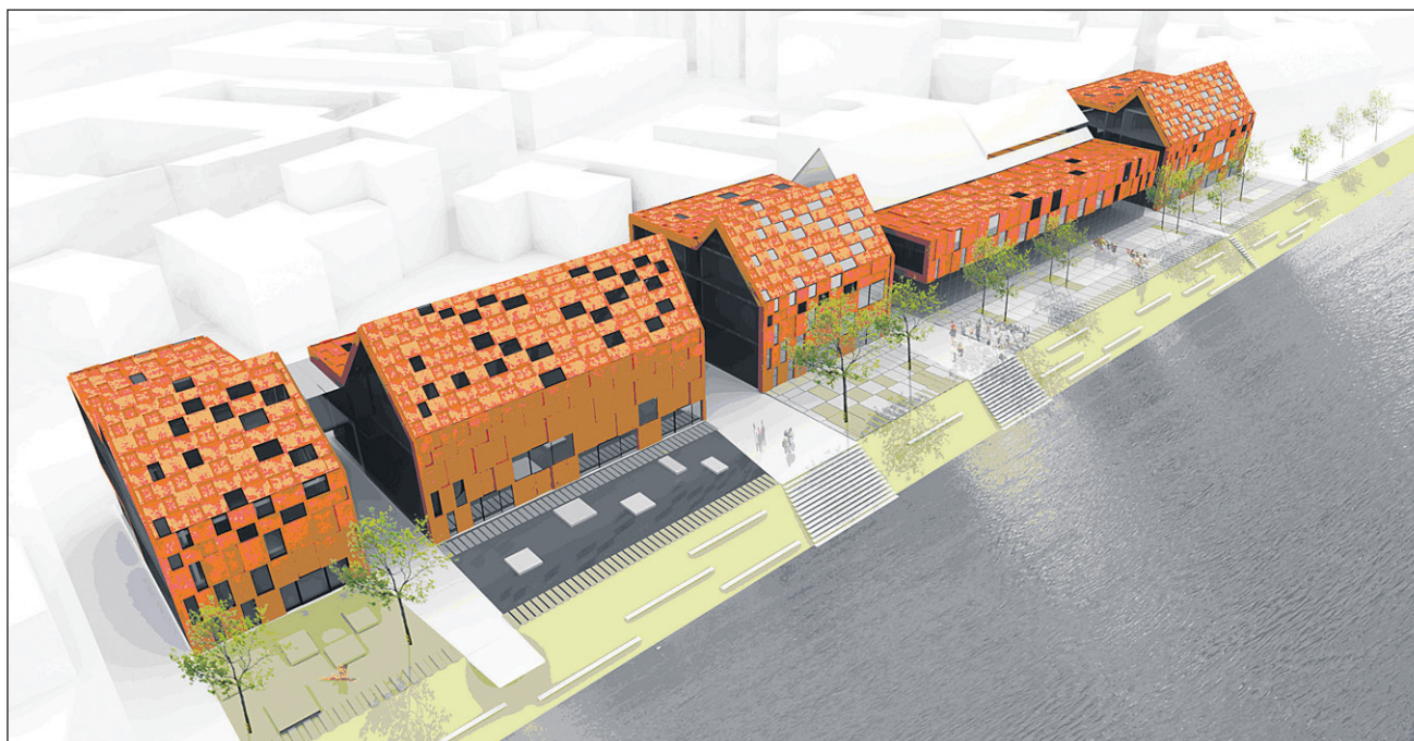
V Dravski ulici na Ptujju bodo v kratkem pričeli graditi nov ptujski mestni hotel, prvega iz verige treh, katerih gradnja je načrtovana v letih 2014, 2015 in 2016.