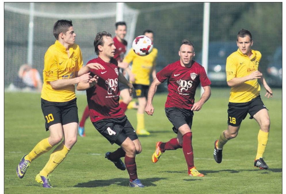
Nogometaši iz Stojncev in Podvincev so v uvodu v spomladanski del prvenstva odigrali izjemno razburljivo tekmo - daljšo pa so na koncu potegnili domačini.

vodilnih ekip. V Stojncih sta se na odlično pripravljenem igrišču pred 300 gledalci v lepem vzdušju pomerili ekipi Stojncev in Podvincev Betonarne Kuhar. Kljub temu da je močno okrepljena gostujoča ekipa veljala za favorita, so zmago slavili domačini, ki so srečanje odigrali z močno spremenjeno ekipo glede na