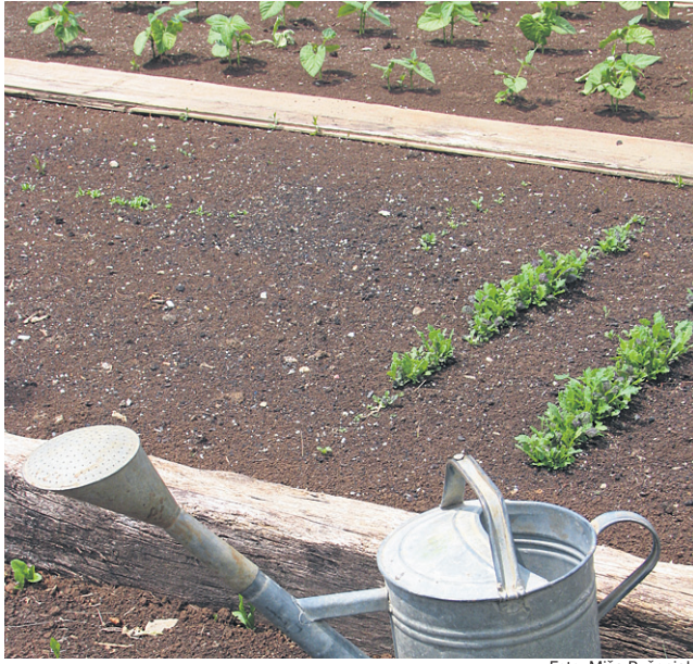
Treba je zalivati.

Lepa, topla pomlad je res omogočila zgodnji začetek dela na vrtovih, vendar bi bilo zdaj zelo potrebno tudi nekaj dežja. Ker dežja nikakor ni bilo dovolj, je treba pričeti zalivati. Zdaj, ko še ni ekstremne suše, je treba vodo samo dodajati, da se prepreči popolno izsuševanje zemlje. Zato si vzemite čas in vrt obilno zalijte. Seveda zalijemo samo grede, na katerih kaj raste. Ker se je košnja zelenic že začela, pokošeno travo kot zastirko položite okoli posajenih sadik in tudi po praznih gredicah. Tako boste preprečili zbijanje zemlje in izsuševanje tal.