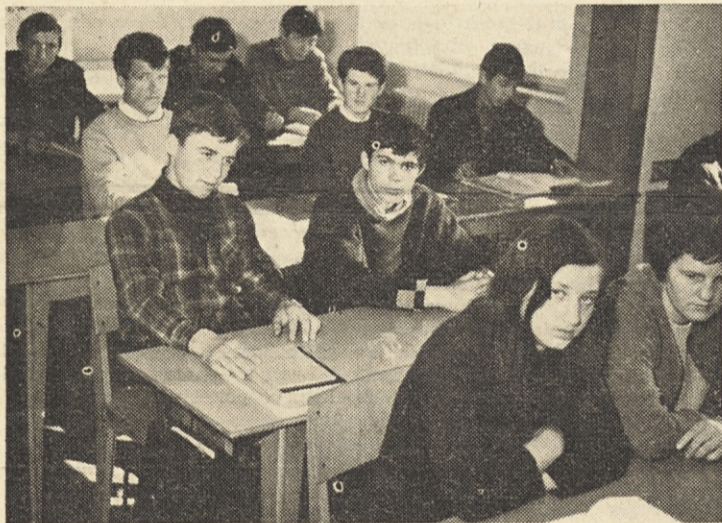
Učenci Poklicne šole pri teoretičnem pouku

Stalni učiteljski kader je skrbel za izpopolnjevanje svojega znanja tako, da je sodeloval na raznih predavanjih — seminarjih. En