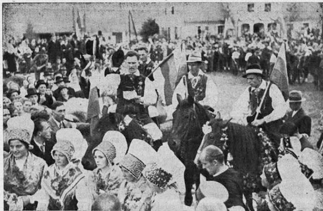
Za uvod v stiške dni se je 15. avgusta vršil svečan sprejem odličnikov, ki so prišli na proslavo v Stično. Fantje na konjih in dekleta v narodnih nošah v zboru pozdravljajo visoke goste.

nikov moral od skupine zelo oddaljiti. To je potrebno zato, da je vsa skupina med seboj povezana ter da ima vodstvo.