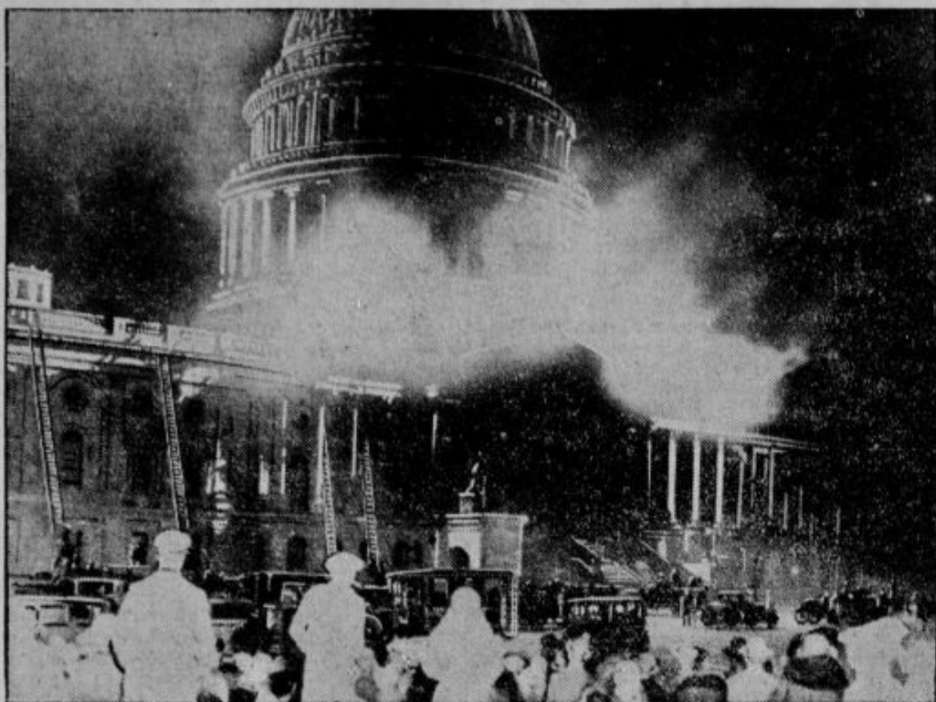
Prva originalna slika o požaru Kapitola v Washingtonu. Kakor smo nedavno poročali, je nastal v ameriškem parlamentarnem poslopu, Kapitolu, v Washingtonu požar, ki je posebno dvijal v kupoli. Ogenj je uničil dragocene dokumente.