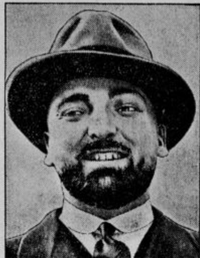
Zunanji minister Grandi, voditelj italijanske delegacije v Zenevi.