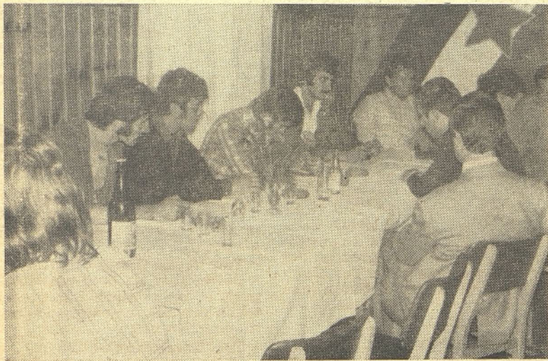
Razgovor o delu mladinske organizacije steklarne je bil zelo ploden

— Zgodovinska naloga in cilj ZK je ustvariti brezrazredno komunistično družbo.