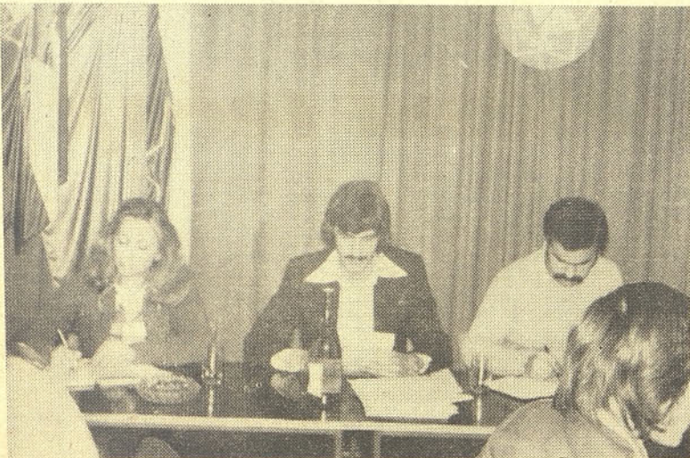
Delovno predsedstvo na programski in volilni seji OK ZSMS Hrastnik