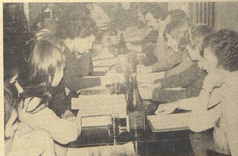
Seje OK ZSMS so se udeležili tudi predstavniki družbenopolitičnih organizacij in Skupščine občine Hrastnik

Sekretar OK ZSMS pa je poslal pismeno poročilo o delu OK ZSMS in predsedstva v obdobju med obema konferencama. Poročilo poleg kronološkega naštevavanja opravljenih nalog in akcij po posameznih mesecih precej realno in tudi kritično ocenjuje dosedanje delo. Nekaj vzrokov za takšno