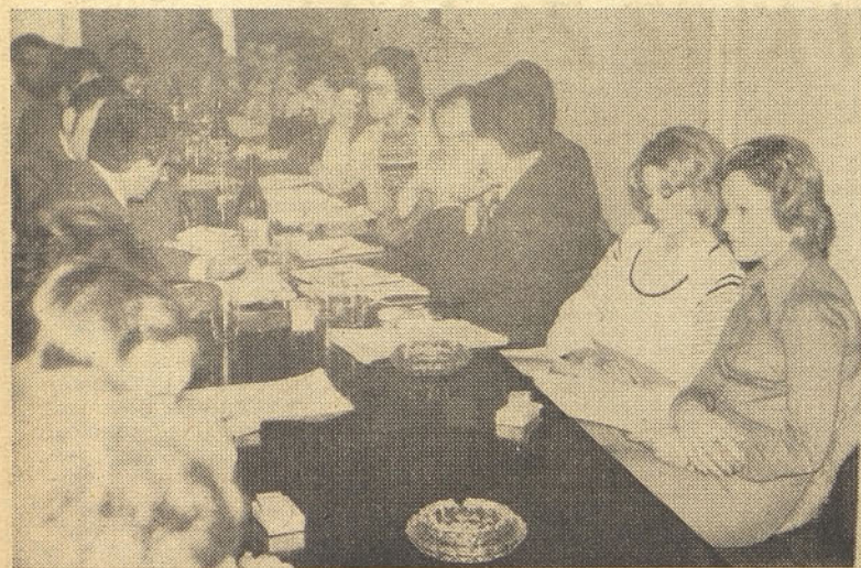
Udeležba na seji OK ZSMS je bila polnoštevilna