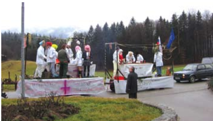
Privat zdravniki so se na poti na virski karneval ustavili pri županu