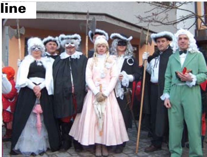
Grajska gospoda iz Tuštanj

Na pustni torek se je odvijalo pustno rajanje tudi v Moravčah, pred Kulturnim domom, kjer sta maškare pogostila Turistično društvo Moravče in Društvo podeželskih žena