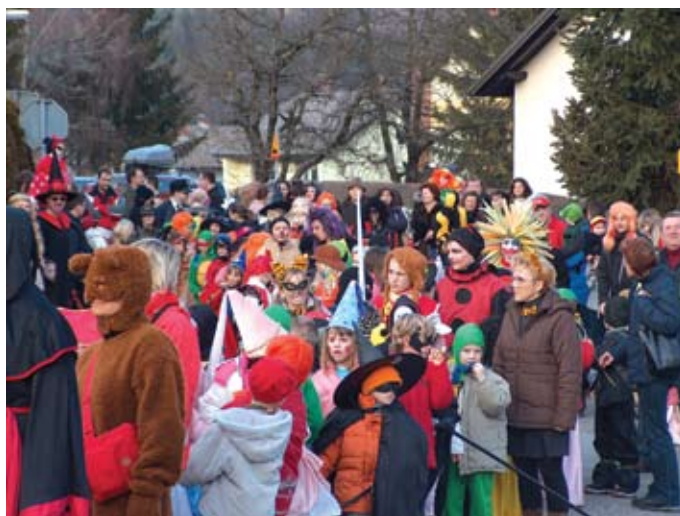
Pust za vse generacije v Moravčah

z domačimi dobrotami. Povorka, sestavljena iz maskirane Pihalne godbe, maskiranih učencev in njihovih učiteljev pa tudi nekaj odraslih domiselnih mask, je bilo videti, se je odpravila izpred Osnovne šole in zaokrožila pri pošti. Predstavila se je Grajska gospoda iz Tuštanj, skupino mask so nam poslali tudi iz pustne sekcije Striček.