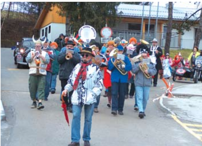
Na čelu sprevoda je igrala maskirana Pihalna godba Moravče