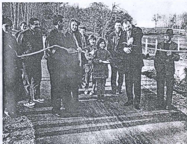
Cesto na Pečkov breg so odprli decembra lani

V vasi je nekaj vikendašev, ki poživijo življenje popoldne oziroma ob vikendih. Sredi vasi stoji vaško-gasil-