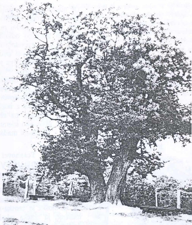
Kostanj na Makoterovem bregu

»Predvsem pa bo potrebno v prihodnje posvetiti več pozornosti družabnemu življenju in organizaciji kulturnih in zabavnih prireditev... Truditi se moramo tudi za to, da se ohrani poseljenost naših krajev, kajti v obeh vaseh je čedalje več starih in opuščenih hiš. Mladi so se doslej nemalokrat odločali za življenje ali celo za gradnjo zunaj domačega kraja, njihove domačije pa so ob tem propadale. Posebno pozornost bo v bodoče potrebno posvetiti delu z mladimi ...«, poudarja prizadevni predsednik sveta KS in opozarja še na dve pomembni stvari: »Posebej se bo potrebno angažirati pri vključevanju lastnikov počitniških hišic in vinskih klet v naših krajih v organizirane dejavnosti v kraju. Naš cilj pa mora biti tudi to, da se vsi tisti, ki kot turisti, izletniki ali kako drugače potujejo skozi naša naselja, pri nas tudi ustavijo in da imajo tako kraj kot v njem živeči ljudje od tega tudi koristi. Potrebno bo v marsikaterem primeru spremeniti miselnost ljudi in jih prepričati, da lahko le s sodelovanjem privedemo do zelenih uspehov«.