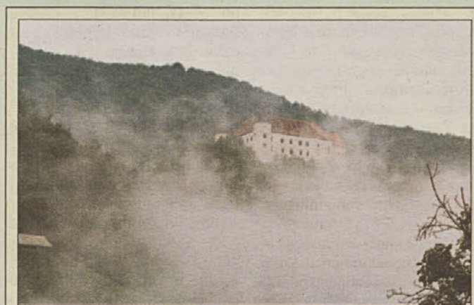
Pri vasi Orešje, na skalnem griču severnega dela bizeljskih gorici stoji mogočna grajska utrdba, grad Bizeljsko (Wisell). Prvič je omenjen leta 1441, a naj bi bil pozidan že sredi 13. st. Grad, ki je v zasnovi srednjeveški, kaže danes renesančne in baročne poteze. Zanimiva in vredna ogleda je kapela sv. Hironima iz leta 1623, kjer sta še vedno ohranjena stropna štukatura in lep baročni veliki oltar. Tako kapelico kot grad obnavlja Ministrstvo za kulturo.

(medeno testo, slano testo, ličkanje, papir, tkanine, les, testenine...). Jaslice iz medenega testa so atrakcija, za svojo zbirko jih je naročil tudi Etnografski muzej Slovenije.