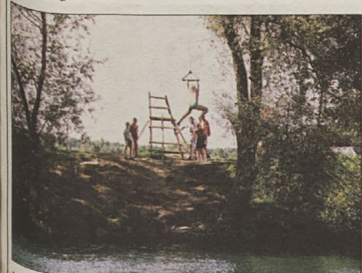
Močno se zanihajo in potem "štrbunk" v vodo!

Kostanjevica na Krki - Da se poletje lahko preživlja tudi v domačem kraju, zgovorno pričča fotografija iz Kostanjevice na Krki, kjer imajo tudi otroci veliko možnosti za zabavo. Tako so zanje pripravili "gugalnico", s pomočjo katere se radosti na reki Krki spremenijo v pravo dogodivščino.