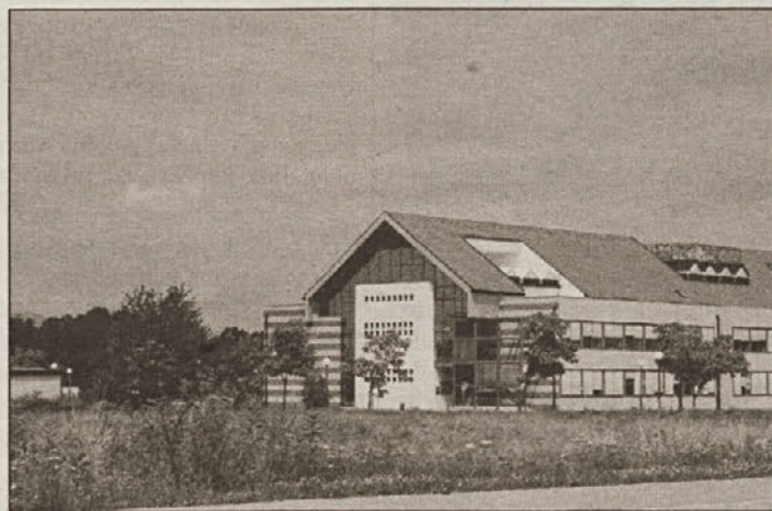
Šola zagovarja dvorano na travniku na fotografiji, strokovne službe pa na drugi strani šole.