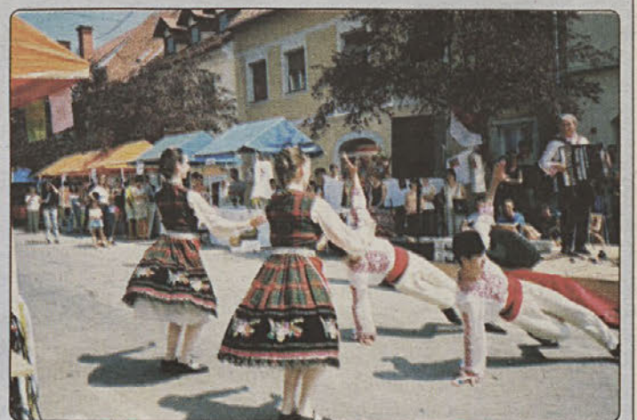
...na strani 11 Etnoples bolgarskih folklornih parov na brežiških ulicah

Brežice - Mladinski center in Društvo študentov Brežice sta organizirala srečanje mladih iz enajstih držav. Srečanje pod sloganom THE ART OF TOLERANCE je potekalo deset dni z dvema velikima dogodkoma - mednarodno mladinsko izmenjavo 66 mladih iz Španije, Portugalske, s Češke, iz Litve, s Finske in iz Slovenije, vzporedno z THE ART OF TOLERANCE pa je Društvo študentov gostilo pet partnerskih organizacij s 16 predstavniki iz Bolgarije, Bosne, Velike Britanije, Madžarske in Makedonije.