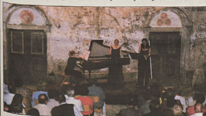
Najboljše iz mednarodnega natečaja na piščekem gradu

Ta petek bodo na piščekem in v soboto na sevnškem gradu nastopili študenti glasbene akademije s Poljske, čez 14 dni pa bosta na obeh gradovih gostovali še študenti glasbene akademije iz italijanskega Bolzana. S.V.