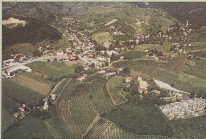
Panorama središča Bizeljskega