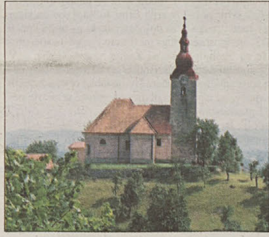
Pogled na hribček s cervijo sv. Lovrenca

Bizeljsko - Razglednica Bizeljskega je pisana paleta naravnih in kulturnih znamenitosti, prepletenih z iznajdljivostjo ljudi. Skorajda ni dejavnosti, iz katere ne bi bila prepoznavna vinska usmerjenost kraja. Ob žlahtni vinski kapljici so ljudje skozi stoletja delali in živeli, danes od nje živijo. Že pred 100 leti so domačini po hudi "trtni uši" pripravili razstavo grozdja in vina, zdaj pa letno pripravljajo več prireditev, posvečenih "žlahtni trti".