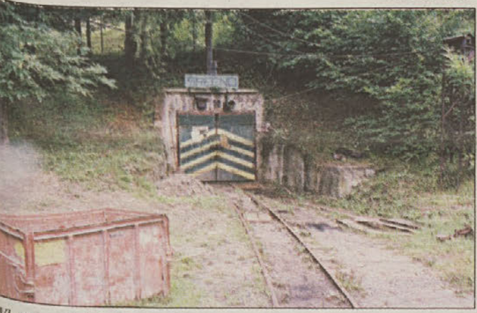
Vhod v rudnik je komajda opazen, "rane" pod površino pa bodo še dolgo odprte.