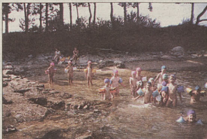
Najmlajši so se v Savudriji najraje zadrževali v vodi, varno z "rokavčki" in podobnimi pripomočki.

Iz morskoga "uživanja" smo si fotografijo izposodili, na preostalih aktivnostih pa smo jih kar obiskali. Udeležencem smo sicer malce zavidali, ko so uživali v brezskrbnih počitniških dneh, a takšne si otroci tudi zaslužijo.