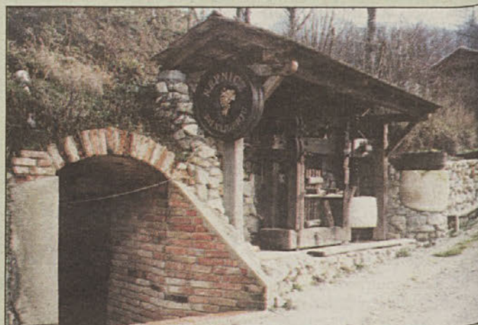
Repnice svoje bogastvo skrivajo v hladni notranjosti.

PGD Bizeljsko bo prihodnje leto praznovalo 110 let delovanja. Ob godovanju zavetnika načrtujejo Florijanovo mašo. Bi-