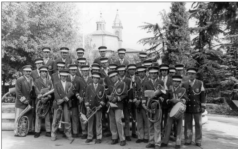
Ob peti obletnici.

Od ustanovitve do pete obletnice je imel orkester 84 nastopov, kar je približno 17 na leto. "V letu 1984 je bilo opravljenih 1 500 ur poučevanja, imeli pa smo 22 nastopov – godbeniki smo ustregli prav vsem, ki so želeli na prireditvi poslušati naš orkester," je v letno poročilo o delu orkestra napisal takratni predsednik Lado Greblo. Pihalni orkester je v prvih petih letih delovanja za svoje delo prejel številna priznanja, kar je člane opogumilo za nove naloge in obveznosti v naslednjem petletnem obdobju.