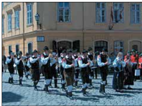
Na Madžarskem, Sopron.