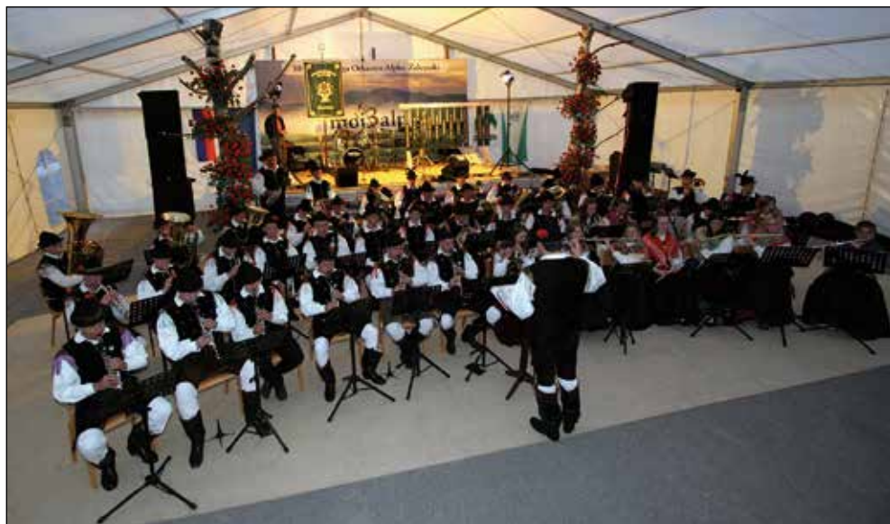
Na 30-letnici.

Zahvala velja naši publikii, vsem vam, ki nas radi poslušate, prihajate na naše koncerte in druge nastope ter nam s svojimi pohvalami in spodbudami dajete nov zagon in potrditev, da smo na pravi poti. Mnogi ste nam na različne načine že velikokrat pomagali. Čeprav vas nismo javno pohvalili, nam je veliko pomenilo in smo (bili) vsake pomoči in pozornosti vedno iskreno veseli.