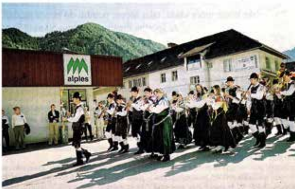
Tridnevno praznovanje Pihalnega orkestra Alples Železniki še ni zaključeno. Praznovanje se bo nadaljevalo 30. junija, na občinski praznik.