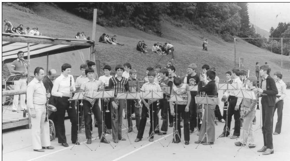
Prvi nastop, 12. julij 1980.

Uspešen nastop je delavce in vodilne prepričal, da imajo mladi muzikanti in njihovi strokovni vodje trdno voljo ter da so sredstva, ki jih podjetje Alples zanje namenja, dobra naložba. Po besedah Lada Grebla, takratnega vodje orkestra, so prvi nastopajoči člani ponovno oživili dolgoletno tradicijo godbe na pihala, ki je včasih v teh krajih že aktivno delovala.