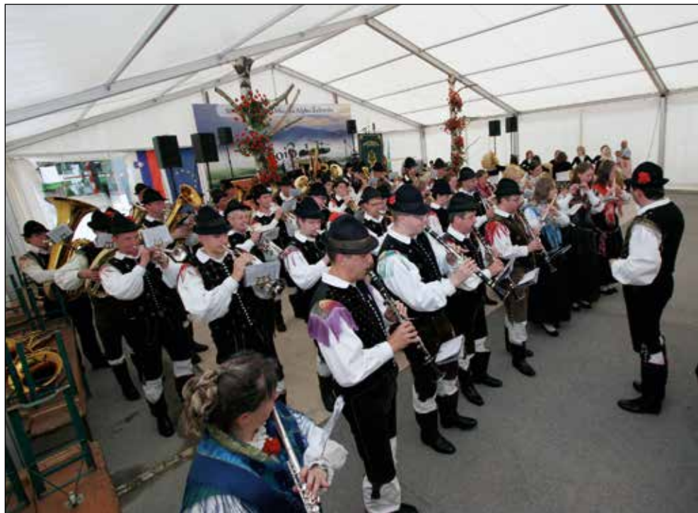
Koncert ob 30-letnici.

Ob koncu se želimo zahvaliti vsem, ki nam stojite ob strani. Prvi v tej vrsti je naš glavni pokrovitelj podjetje Alples, d. d. Podjetje nam je, razen v letu svojih največjih težav, vedno stalo ob strani in nas finančno podpiralo. Od svoje ustanovitve dalje nas z dotacijami podpira Občina Železniki.