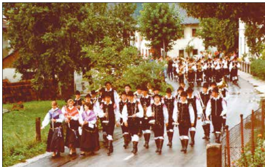
Povorka ob 15. obletnici, v ozadju Godba Gorje.

Ob koncu leta so se za orkester začeli boljši časi. Urejati se je začelo financiranje, poleg tega nam je Kmetijsko-gozdarska zadruga Škofja Loka, Enota Češnjica omogočila brezplačen najem prostorov. Pogodba o nadaljnjem sodelovanju je bila podpisana v letu 1995.