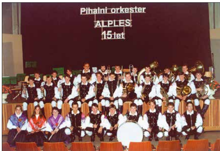
Ob 15. obletnici.