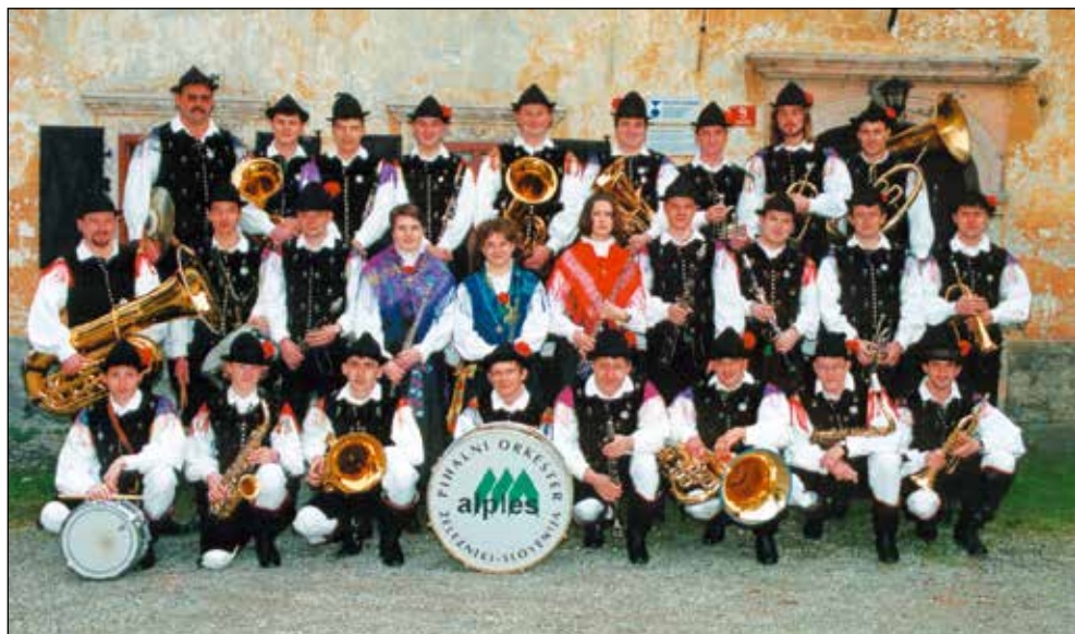
Ob 20. obletnici.

Ob praznovanju 20. obletnice delovanja smo v Pihalnem orkestru Alples Železniki izpeljali dve prireditvi: samostojni koncert ter srečanje pihalnih orkestrrov. Na jubilejnem koncertu 25. junija v kinodvorani na Česnjici je potekala tudi podelitev bronastih in srebrnih Gallusovih značk za dolgoletno delo v ljubiteljski glasbeni dejavnosti. Repertoar je bil večinoma sestavljen iz skladb, ki so bile posnete na kaseti in zgoščenki, saj je bil koncert hkrati promocija našega novega izdelka. Praznovanje smo nadaljevali v nedeljo, 27. junija, s srečanjem pihalnih orkestrrov, ki je bilo pod šotorom pred plavžem v Železnikih. Srečanje, na katerega smo povabili Godbo