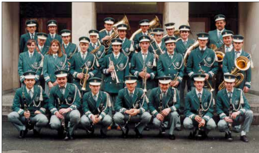
Zadnjič v zelenih uniformah.

ster začel nastopati v novi podobi. Odločili smo se za nakup novih uniform in sklenili, da si obleko kupi vsak sam, kar je bila ob takratni finančni situaciji edina rešitev. Zgledovali smo se po Godbi Gorje in se dogovorili, da bomo ob praznovanju 15-letnice začeli nastopati v slovenskih narodnih nošah.