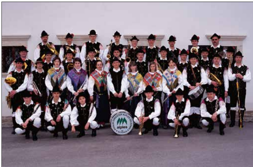
Ob 25. obletnici.

Nedeljsko popoldne je bilo namenjeno srečanju pihalnih orkestrrov Gorenjske. Tako so v Železnike prišli godbeniki iz Godbenega društva Bohinj, Pihalnega orkestra Tržič, Pihalnega orkestra Jesenice – Kranjska Gora in Mestnega pihalnega orkestra Škofja Loka. Posebna gosta ob praznovanju našega srebrnega jubileja sta bila Godba Gorje in Pihalni orkester Alpina Žiri. Srečanje smo pričeli s povorko iz Dašnice do prireditvenega prostora. V povorki je