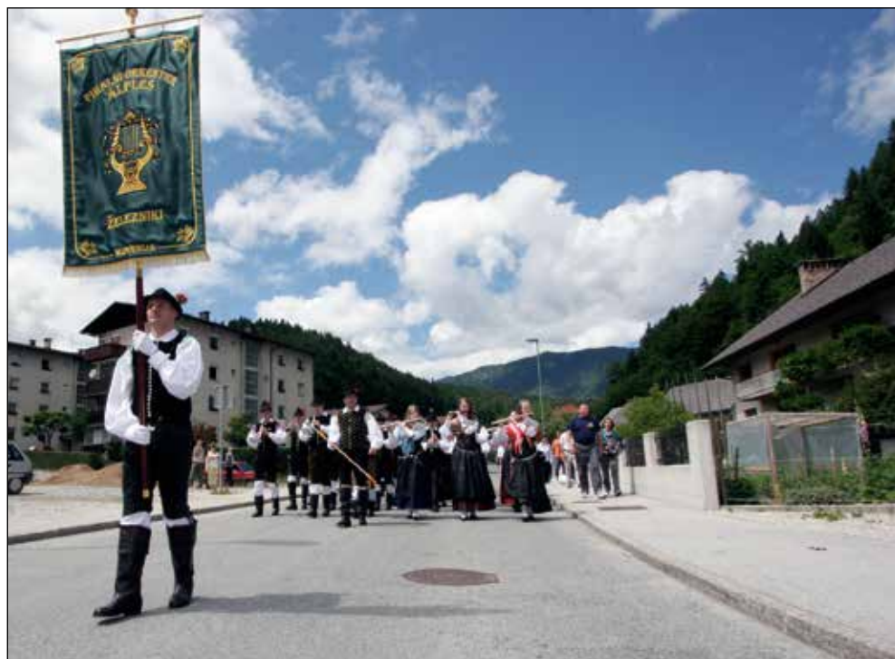
Orkester s praporom.