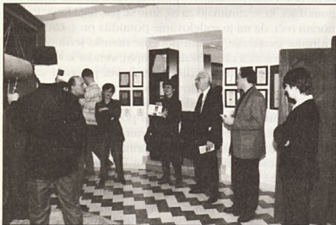
Tretji član komisije za izbor Evropskega muzeja leta 1997, g. Wim van der Weiden med ogledom MMI.

članov uredniškega odbora. Ne nazadnje pa je naš muzej odprt 365 dni na leto in naše objekte obišče okrog 60.000 obiskovalcev. In tudi njim je namenjena naša skrb. Čeprav se srečujemo z mnogimi problemi, delamo z veliko dobre volje in to rojeva rezultate.