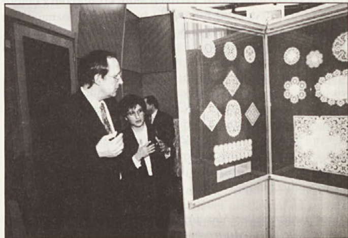
Otvoritev razstave o čipkah v Ženevi. Foto: Janez Pelko, marec 1996. Iz fototeke MMI.

Ne, kvečjemu bi lahko rekla, da mi je pomagalo ustvariti svoje dobro ime. Saj veste, da se je v domačem kraju praviloma najtežje uveljaviti. Izkazalo se je, da sem v svoji