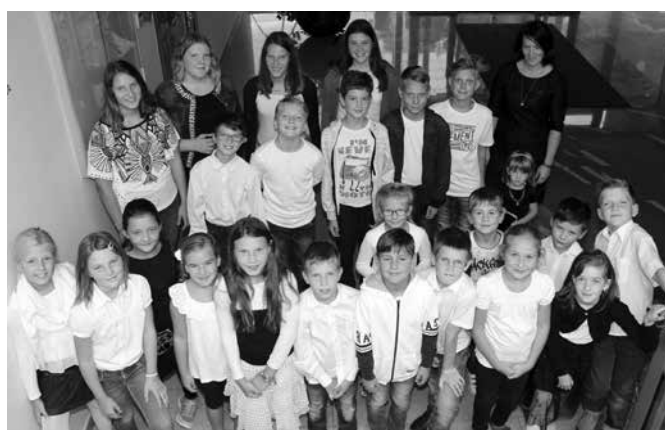
Z mladimi tamburaši je nastopil otroški zbor sv. Miklavža

Tamburaška glasba že kar nekaj časa bogati občino Majšperk, zadnjih nekaj let pa ima naš orkester še posebno tamburaško šolo, v kateri se mladi učijo igranja na ta zanimiv inštrument, hkrati pa pri tem nastaja podmladek orkestra. Ta podmladek smo mi, skupinica osnovno- in srednješolcev, ki se igranja na tamburico pod vodstvom našega predsednika