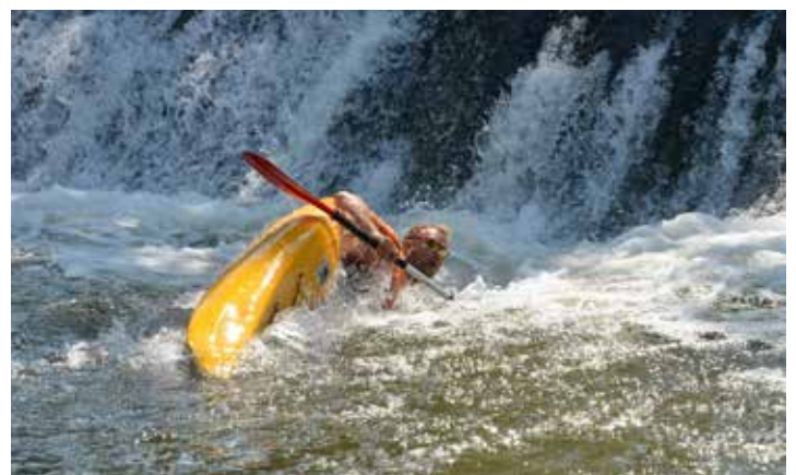
Spust po Dravinji