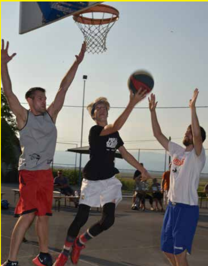
Boj pod košem – košarka 4 na 4