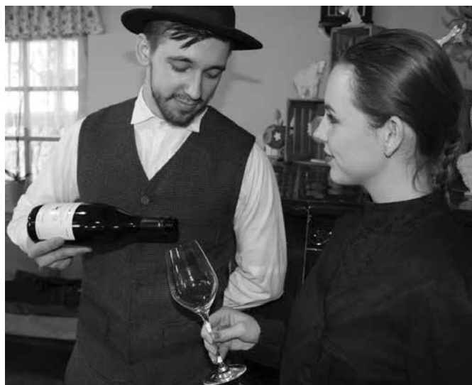
Vrhunsko haloško kulinariko bo streglo osebje v tradicionalni haloški noši