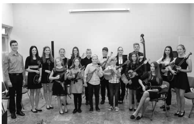
Podmladek tamburaškega orkestra