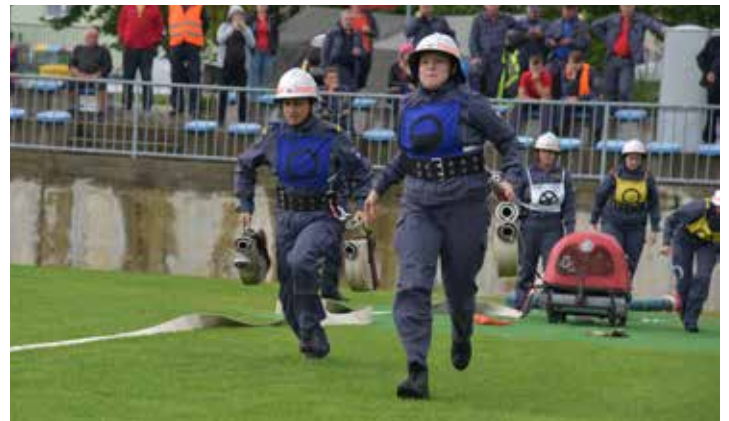
Tekmovanje za memorial Cirila Murka