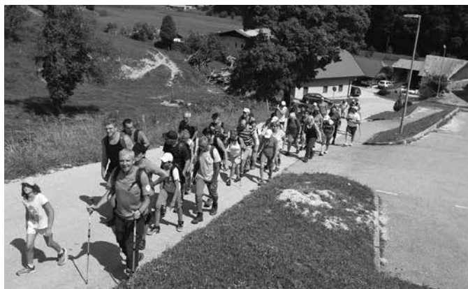
Pohod po občini

avgustu nam je pri organizaciji izletov zopet malo ponagajalo vreme, a kljub temu je manjši skupini naših planincev uspel vzpon na 2472 m visok Špik.