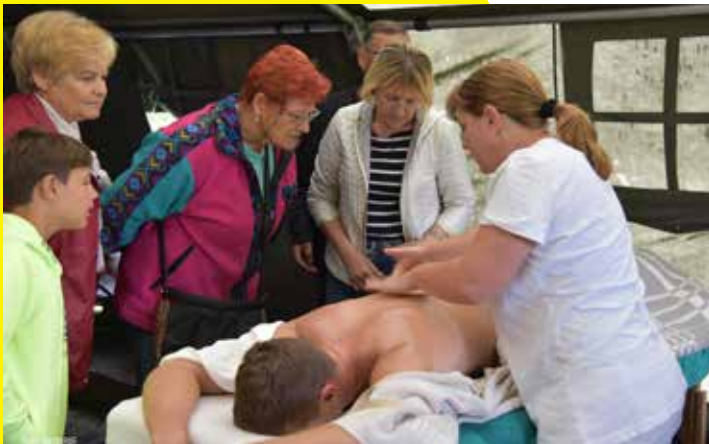
Medena masaža na čajanki v Preši