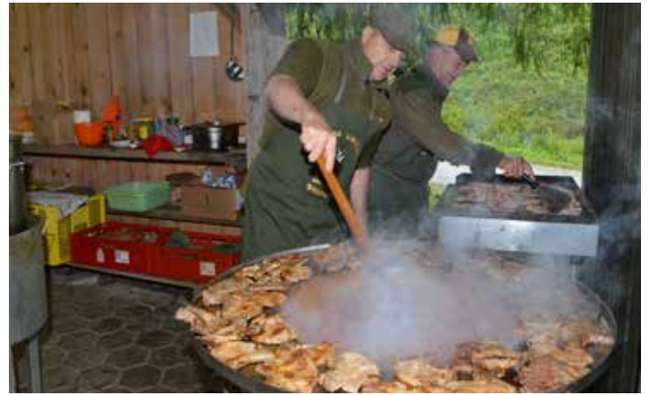
Na srečanju lovcev se je dobro jedlo