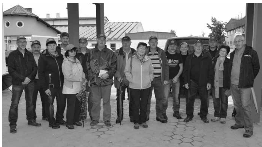
Pohodniki od kleti do kleti