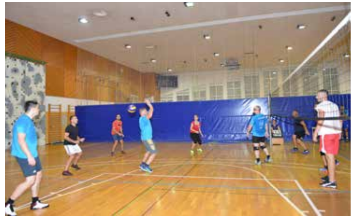
Tekmovanje v odbojki