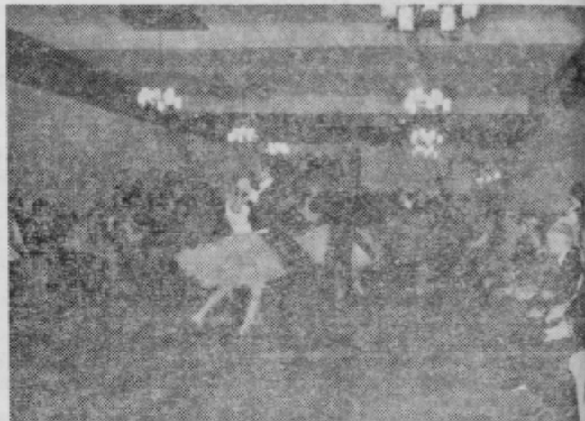
Plesni pari so pritegnili gledalce

Številne gledalce, bila jih je polna dvorana, so še pose-