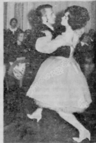
Zdrsela sta po parketu

bej navdušili takoimenovan ekshibicijski plesi, kjer se plesni pari pokazali, da plesni samo šport in razvedrilo ampak tudi umetnost.