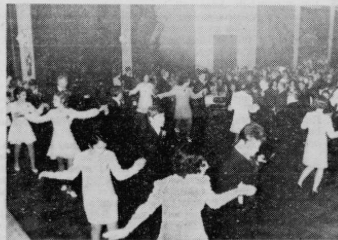
Plesni venček maturantov

Za dobro voljo je poskrbel (poleg dobre kapljice) tudi tovariš Vičar s šalami iz gimnazijskega življenja. Na plesišču je bila neprestano gneča. Mladi in stari smo se vrteli ob valčkih, pa tudi brez polke ni šlo. Nekaj hude kr-