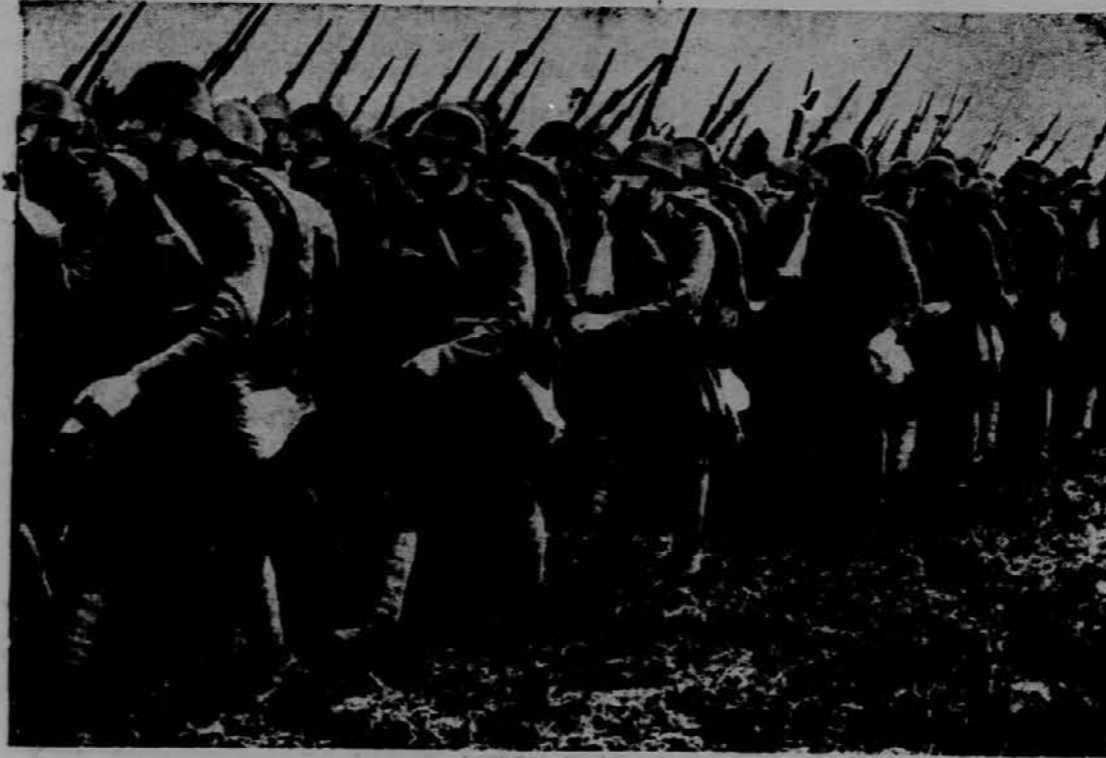
Čehoslovaška infanterija na pohodu na velikih manevrih.