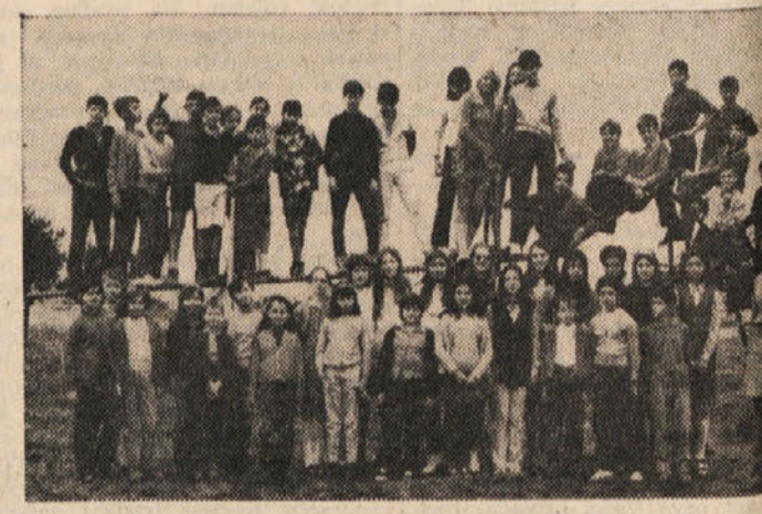
Tržaški otroci in otroci iz okolice v Zgoranjih Gorjah