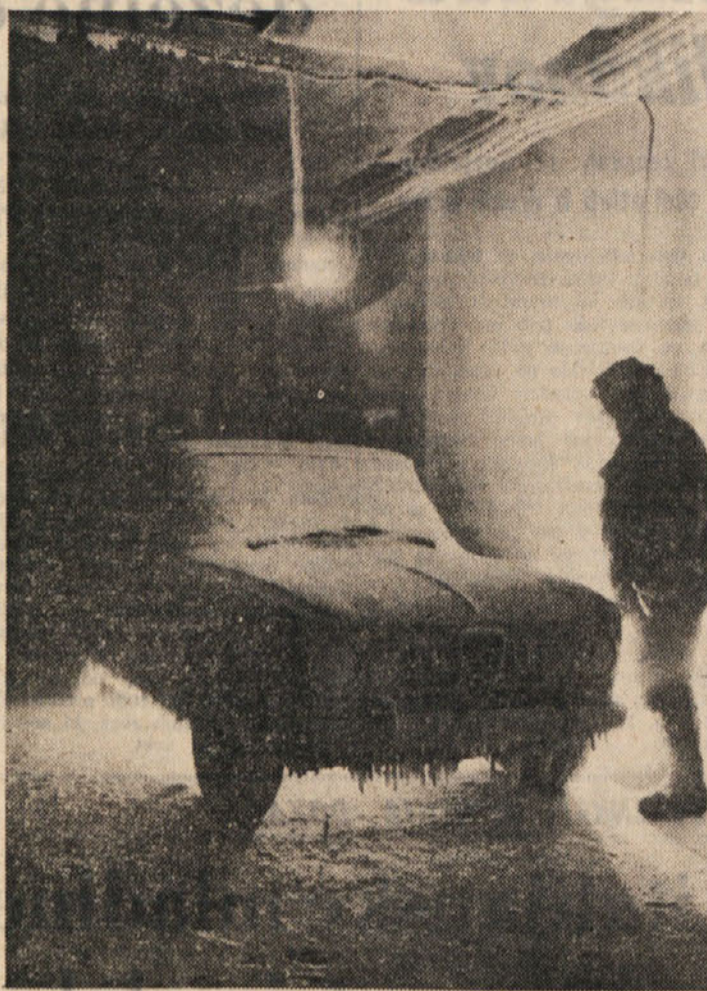
S poskusov za ugotovitev varnosti avio alfa romeo. Tudi s 20 stopnjami pod ničlo mora vozilo brezhibno delovati, takoj startati ter nuditi potnikom gorkoto in udobje