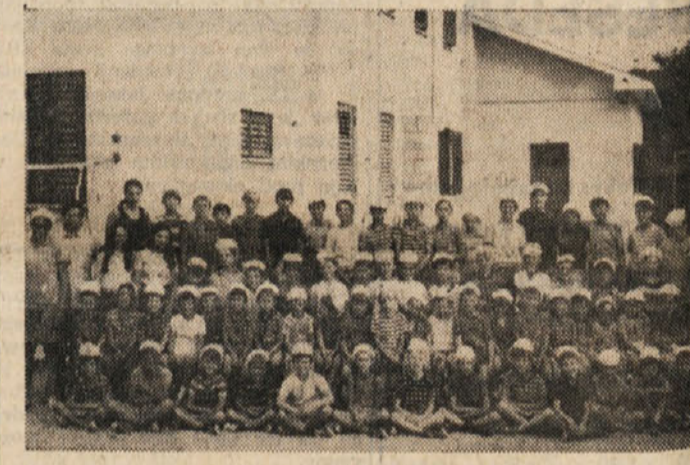
Tržaški in okoliški otroci v Dragi

Kakor prejšnja leta, je komisija za dorajajočo mladino pri Slovenski kulturno gospodarski zvezi tudi letos pripravila tri izmene počitniških letovanj in sicer v Lovranu pri Opotju, v Savudriji in v Zgoranjih Gorjah pri Bledu. Na počitnicah v matično domovino so se prijavili otroci s Tržaškega, z Goriškega in iz Benečije. Na vrhnji sliki je najmanjša skupina otrok, ki je od 1. do 21. julija letovala v decjem domu «Olgina Ban» v Lovranu. Poleg glavne «skrbni» — kovanja v čudovito sistem morju — so naši otroci izkoristili dovolj odločno bivanje za popoldanske in večerne izlete v sosednje kraje Medvoje, Iko, Ičiće, Reko ter za celodnevni izlet na