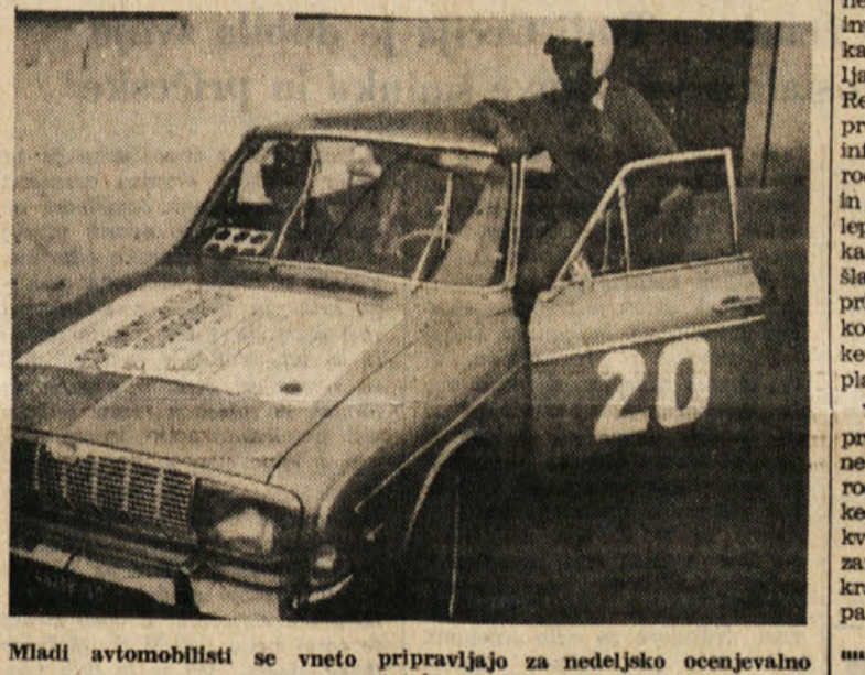
Moji avtomobilisti se vneto pripravljajo za nedeljsko ocenjevalno avtovožnjo

V Štandrežu in po vseh drugih slovenskih vaseh ter v Gorici sami vlada veliko zanimanje za ocenjevalno avtovožnjo, ki jo priredi v nedeljo, ob priložnosti 25-letnice ustanovitve društva, prosvetno društvo «Oton Župancič» v Štandrežu. Domesel prizadevanj štandrežev je zelo dobrodošla, saj je prav, da se naša društva opirajo tudi najmodernejšim oblik družabnega in športno-rekreacijskega življenja.