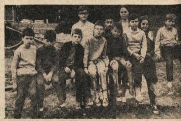
Goriški otroci na počitnicah v Gorjah