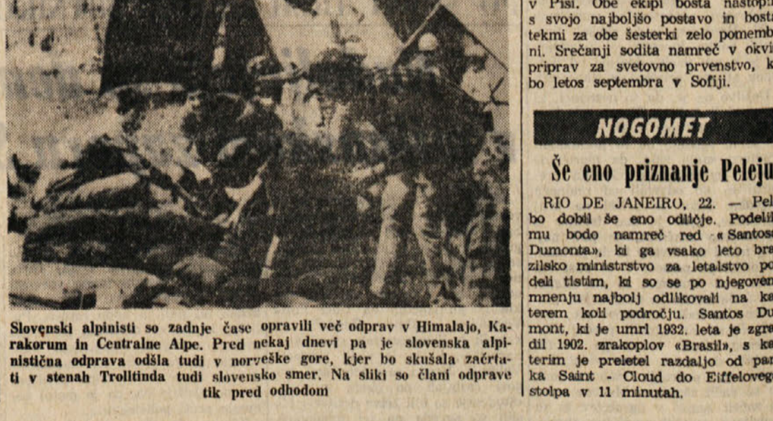
Slovenski alpinisti so zadnje čase opravili več odprav v Himalajo, Karakorum in Centralne Alpe. Pred nekaj dnevi pa je slovenska alpinistična odprava odšla tudi v neravske gore, kjer bo skušala začrtati v stenah Trollfunda tudi slovensko smer. Na sliki so člani odprave tik pred odhodom

da bo odhod na tečaj v nedeljo, 26. t.m., zjutraj iz Trsta. Točna ura in kraj odhoda bosta objavljena jutri.