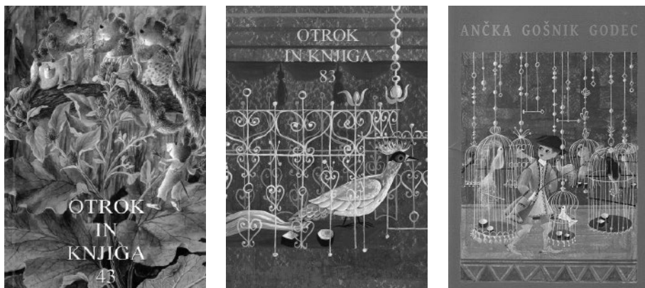
Ilustracije Ančke Gošnik Godec na naslovnica revij Otrok in knjiga (1997, 2012) ter na razstavnem katalogu Galerije Rika Debenjaka Kanal na Soči in Kulturnega centra Lojzeta Bratuža v Gorici (2021).