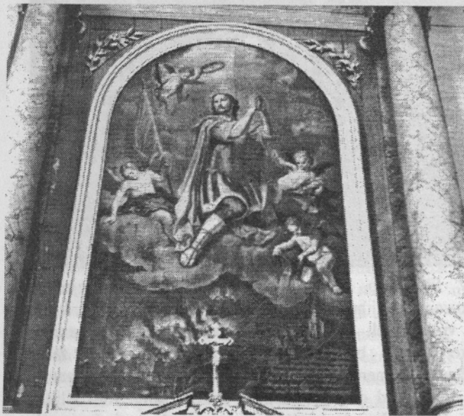
OLTAR SV. FLORIJANA V FARNI CERKVI V TRŽIČU

Vsako leto se velikonočne procesije udeleži več ljudi. Letos so jih v glavni farni cerkvi naštel najmanj 410. V soboto, 4. maja ob 17. uri pa bo tradicionalna Florjanova procesija. Sodelovala bodo gasilska društva iz Tržiča, godba na pihala in ostali udeleženci. Prvič v zadnjem času bo potekala tudi po glavni tržiški ulici - Trgu svobode.