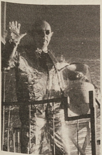
Prizor iz filma Butnskala

Vlak, nabito poln vseh vrst Jugoslovanov, se ustavi sredi proge, ker