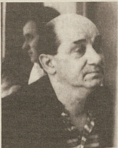
Solastnik Prealpi Minerarie Giulio Rota

Na kraju nesreče pa še vedno iščejo trupla. V zadnjih dneh so raziskave osredotočene predvsem na območje, kjer se hudournik Stava izliva v reko Alvisio. Zaradi blata, ki zavira odtekanje voda, je na tem mestu nastalo 5 do 6 metrov globoko močvirje. Tu so včeraj našli 7 trupel, tako da je njihovo število naraslo na čez 200. Od teh jih je okrog 170 identificiranih, pogrešajo pa še kakih 100 oseb.