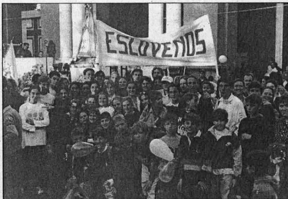
Slovenska mladina iz Mendoze roma v Luján.