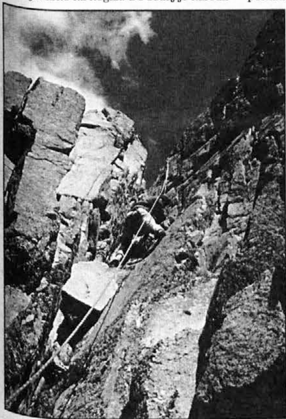
V steni Piedras Blancas.