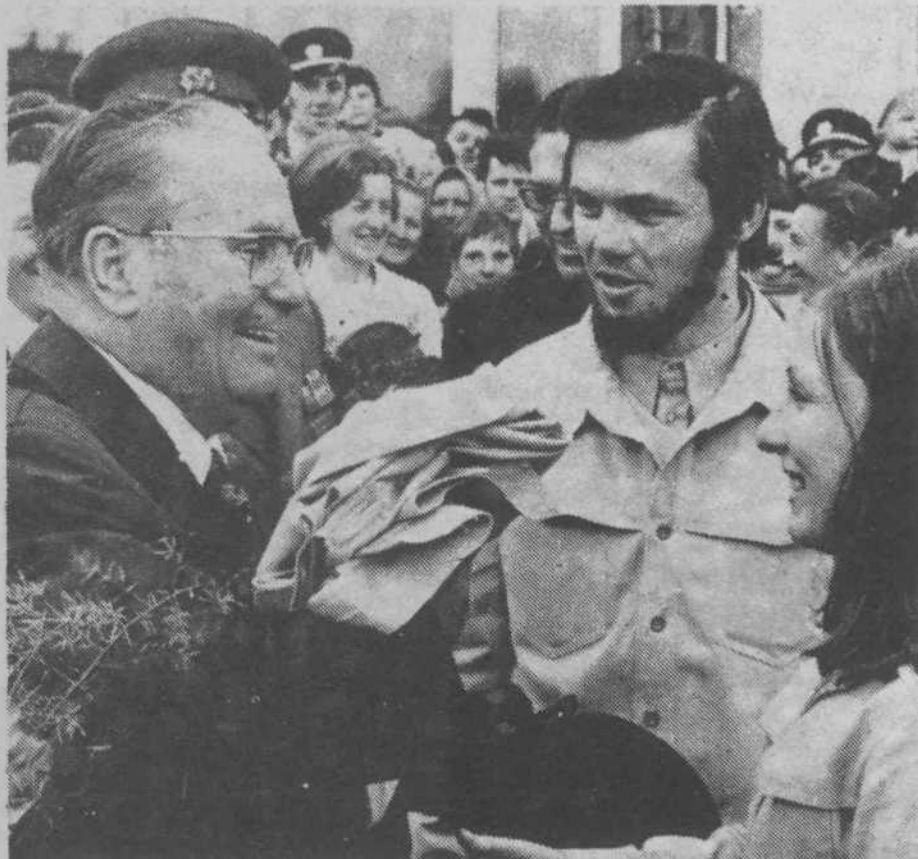
Tito in mladi