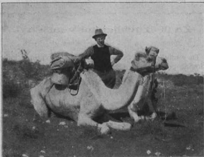
Misijonar s kamelami na misijonskem potovanju.

Misijonar mora skrbeti, da ljudi večkrat obiše, ker je sam, in to zlasti tiste, ki stanujejo gosto naseljeni po središčih. Vendar uspehi niso isti kot bi bili, ako bi ljudje imeli svojega misijonarja, ki bi stalno bival med njimi. Zato bi mi radi storili kot so apostoli, kadar so ustanovili kako krščansko občino: izročili so jo v oskrbo duhovnikom in dijakonom. Naši dobri katehisti so res pravi dijakoni.