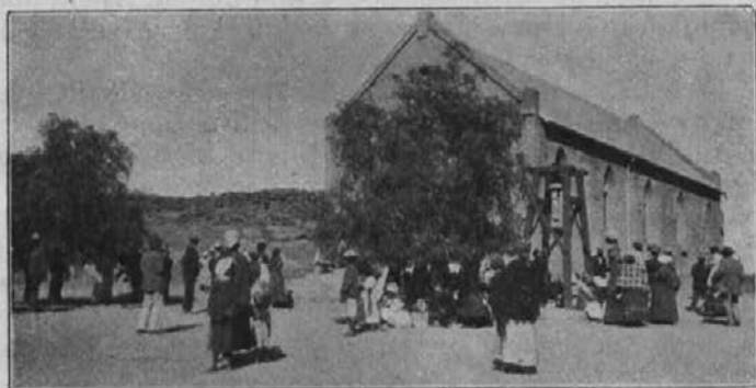
Po službi božji na neki misijonski postaji.

Uboga paganska sužnja začne preišljevat svoje žalostno stališče; o kako zavida svojo krščansko tovarišico za njeno srečo, njene ljubeznive, krščanske otročiče. Kako hrepeni tudi ona postati kristjana, dobra družinska mati! Ta želja je upravičena in odkritosrčna in se vedno silneje oglašča v njenem srcu. Toda, če postane kristjana, mora zapustiti svojega paganskega moža, ki se navadno noče spreobrniti z njo vred; pripravljena mora biti nadalje na