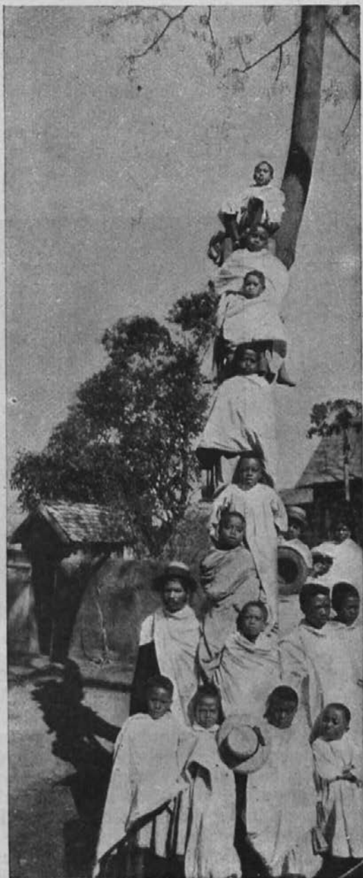
Kvišku proti nebu!

Svoje potovanje sva dobro izrabila. Vsak dan sta bili dve ali tri pridige o poglobitnih resnicah sv. vere.