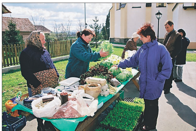
Na predvelikonočni kmečki tržnici so svoje pridelke in izdelke ponujali na 15 krepko obloženih stojnicah