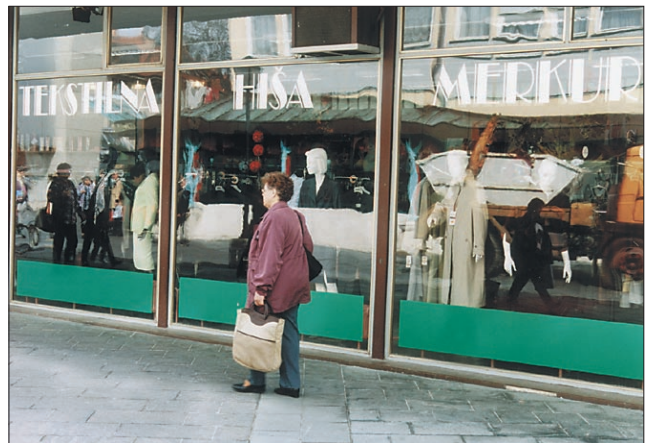
Tekstilna hiša v Volanu na Novem trgu le še do konca tedna. Zibelke Emone - Merkur ni več.

LOVRENC / CERTIFIKAT ISO 14001 PODJETJU ALBIN PROMOTION