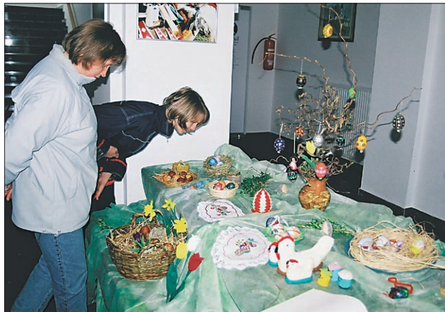
Posebnost je pomenila prva razstava velikonočnih pisank društva podeželjskih žena.

Na kmečki tržnici, ki so jo pripravili člani izvedbenega odbora za celostni razvoj podeželja in vasi v občini Markovci, so v soboto, 23. marca na ploščadi za občinskim poslopjem poleg prodaje domačih izdelkov in pridelkov na 15 stojnicah, prikazali tudi izdelovanje velikonočnih presmecov, ki morajo biti v celoti iz mladih pogajnkov lesa, oziroma iz naravnega