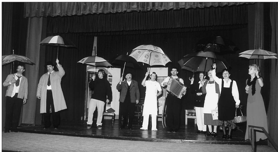
Prizor iz enodejanke Izgubljeni dežnik.