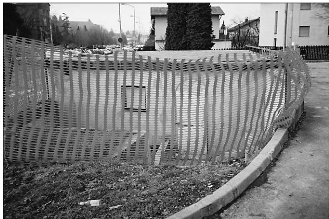
Rimska peč je bolj bunker kot arheološki spomenik

GORIŠNICA / CELOVEČERNA PREDSTAVA S TREMI ENODEJANKAMI