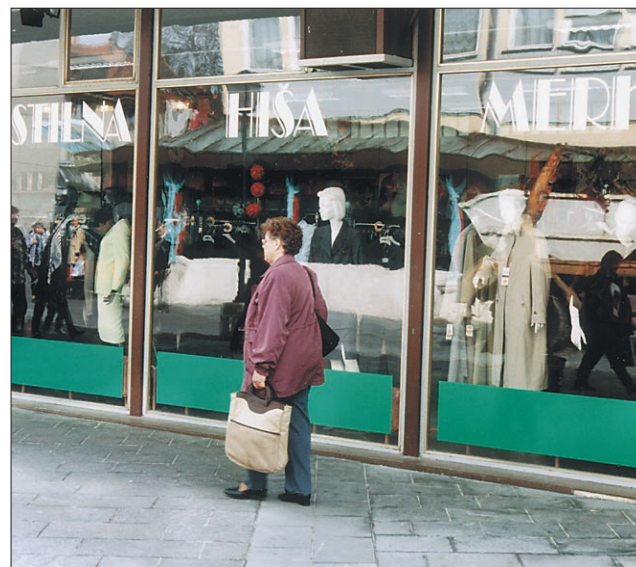
Tekstilna hiša bo v Volanu na Novem trgu le še do konca tedna. Zibelke Emone - Merkurja ni več.