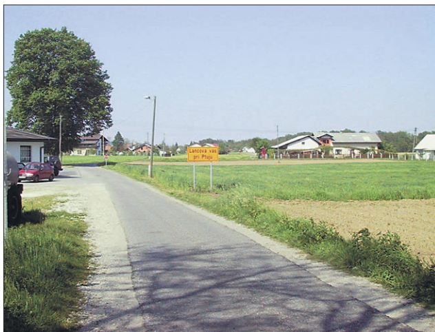
Se bo tabli Lancova vas pri Ptuju kmalu pridružila še tabla občine Hajdina?