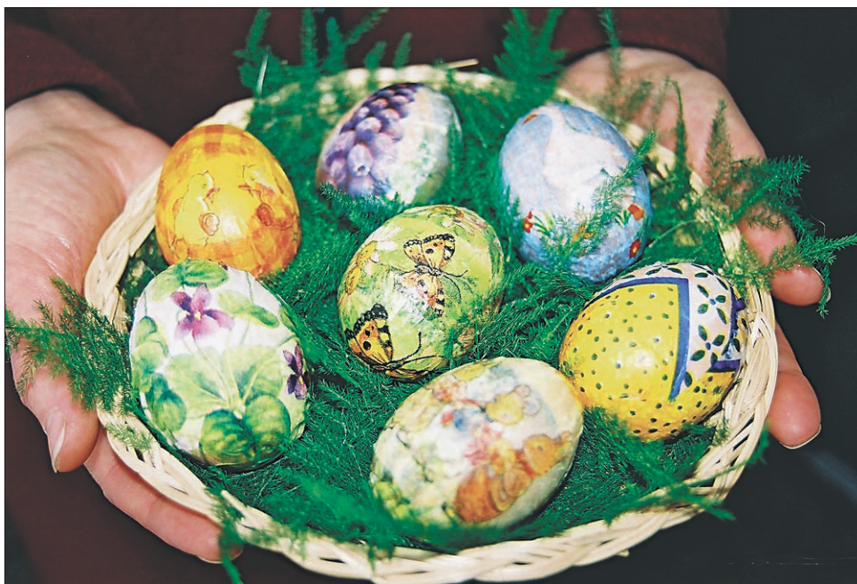
Vsem bralcem želimo prijetne velikonočne praznike!