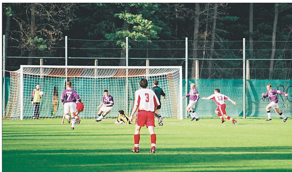
Zmagoviti zadetek Aluminija.

Kidričani so si priborili minimalno prednost, ki jim daje pred drugim polfinalnim srečanjem upanje, da bi s ponovitvijo dobre igre lahko celo postali letošnji finalisti tekmovanja za slovenski pokal. Vsekakor možnosti so in bo vse prej kot lahko,