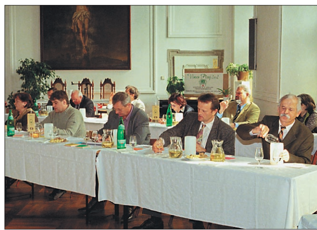
Dvanaajsto ocenjevanje »Vino Ptuj 2002« je bilo v refektoriju minoritskega samostana

Tudi danes ste nekaterim vinogradnikom zamerili prez-