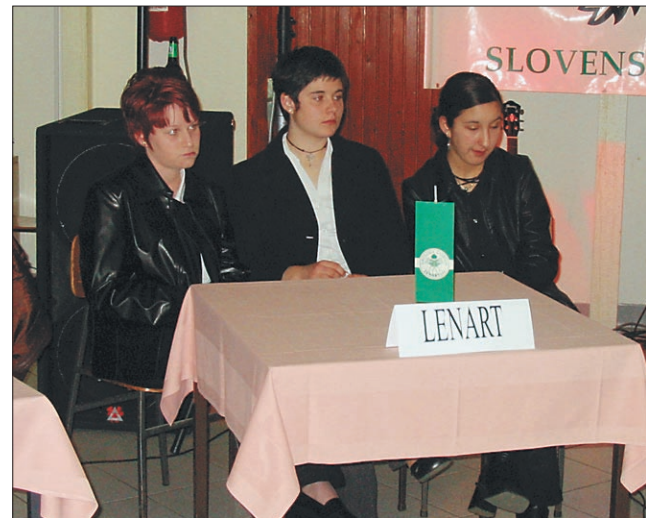
Zmagovalna ekipa Lenarta