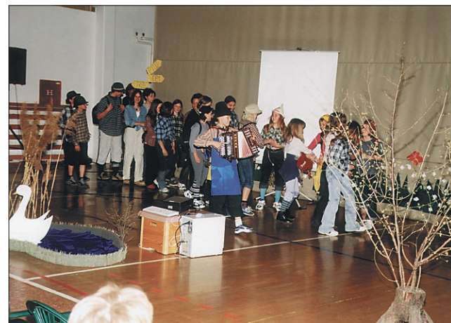
Utrinek s prireditve ob dnevu šole.

Na začetku pomladi praznujejo v osnovni šoli Videm svoj dan šole v spomin na prvi pomladni dan leta 1994, ko so se preselili v novo šolsko poslopje.