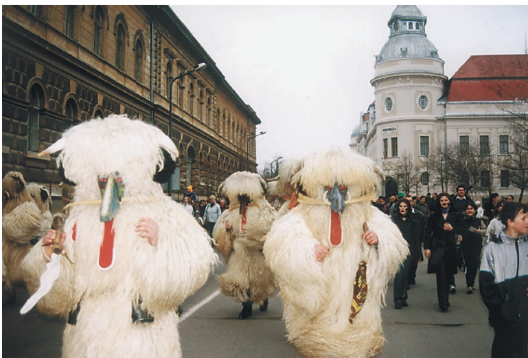
Karnevalski sprevod po ulicah Szentesa je bil vrhunec pustnega dogajanja v tem madžarskem mestu