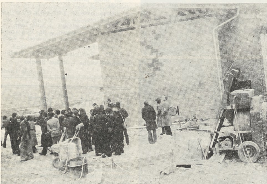
KZA »DONAT« na delovni akciji St. Primož na Koroškem