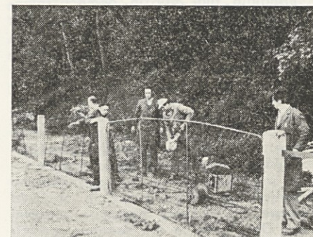
Skrb za lepši videz vrtnarije