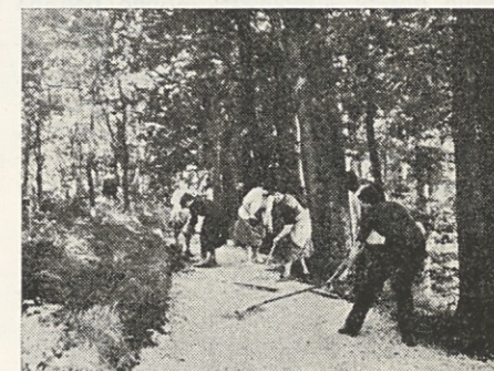
Urejanje sprehajalnih poti