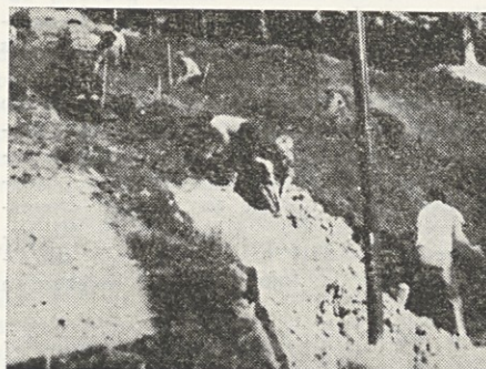
Drenažiranje plazu pri hotelu Sava