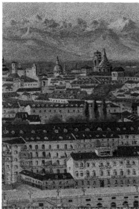
Pogled na Alpe z Monte dei Capuccini

S turinskega griča Monte dei Capuccini se ob jasnem vremenu ponuja čudovit pogled na skoraj 500 km dolgo verigo Zahodnih Alp, ki se dviguje na obzorju nad mestom. Ni bilo naključje, da si je Italijanski alpinistični klub (CAI, Club Alpino Italiano) izbral prav nekdanji kapucinski samostan na tem griču nad Turinom za svoj muzej. Leta 1871 je cerkev samostan z vsem pripadajočim zemljiščem prepustila turinskemu mestnemu svetu, ta pa je leta 1874, ob desetletnici ustanovitve CAI, ustanovil v enem od stolpov observatorij za opazovanje gorá. Leta 1877 so odprli prvo muzejsko zbirko, ki je sprva zajemala le predmete, pomembne za razvoj italijanske planinske organizacije. Zani-