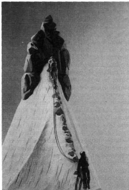
Lesen model v muzeju: stara tehnika plezanja in varovanja

Celotno prvo nadstropje muzeja je posvečeno alpinizmu v najširšem smislu, pa tudi nekatere druge športne dejavnosti, ki se odvijajo v gorskem svetu, so mu postavili ob bok. Tu lahko vidimo staro plezalno opremo, pa tudi tehnike gibanja v gorah, ki so jih uporabljali v posameznih obdobjih, razvoj posameznih delov opreme, bivakov, planinskih zavetišč in postojank, skratka - če si filmski režiser zaželi v svojem filmu prikazati, kakšno je bilo plezanje v začetku našega stoletja, mu takoj lahko postrežejo z zelo natančnimi podatki in mu pokažejo tudi originalno opremo iz tistega časa.