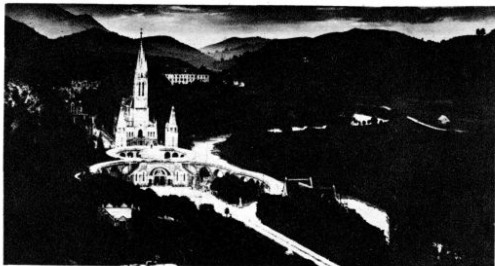
Lurška bazilika razsvetljena ob sklepu svetega leta, 27. aprila 1935