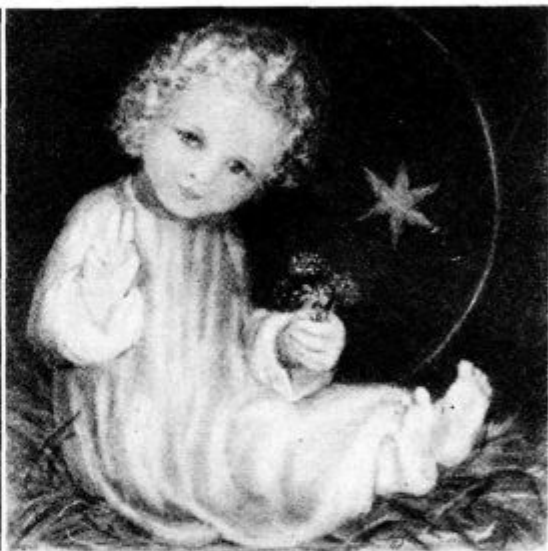
Jezus, blagoslovi nas!