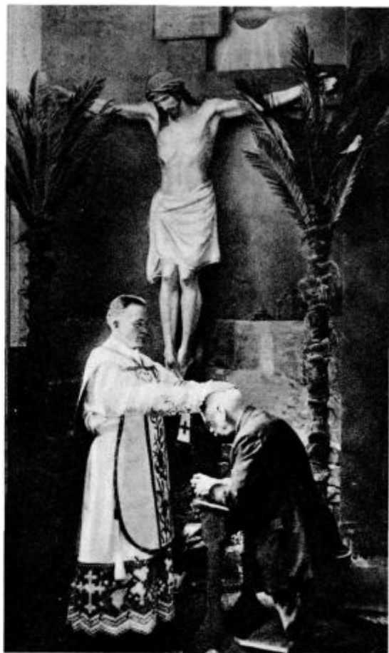
Novomašnik blagoslavlja svojega očeta

Kolika sreča je v takih primerih krščanski vzgojitelj v šoli, saj gredo vzgojni žarki