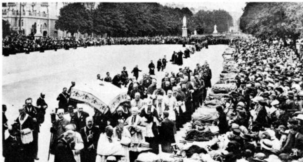
Blagoslovljenje bolnikov s sv. R. T. v Lurdu

»Kakor se vzame. Lahko, ker jih je nam narekovala božja ljubezen. Težko pa, ker zadenemo na toliko zaprek. Naš napuh nas neštetokrat zapelje na napačna pota.