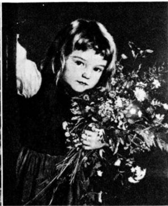
Cvetke za Jezusa

Česar se Janezek nauči, to Janez zna; česar se otroci navadijo, taki so.