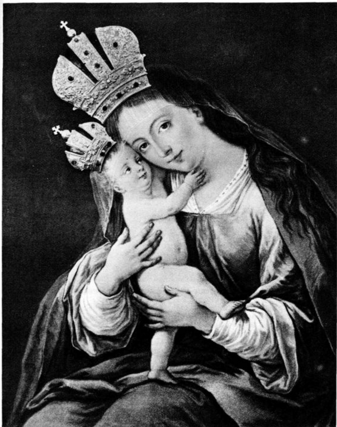
Slika Marije pomočnice na Brezjah

sija« ji je ime. Ta te bo gotovo dodobra seznanila z Jezusom.»