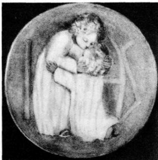
Ljubi Jezus, zahvalim te, da si prišel v moje srce

»Mana, ali veš, kaj se pravi poznati Jezusa Kristusa?«